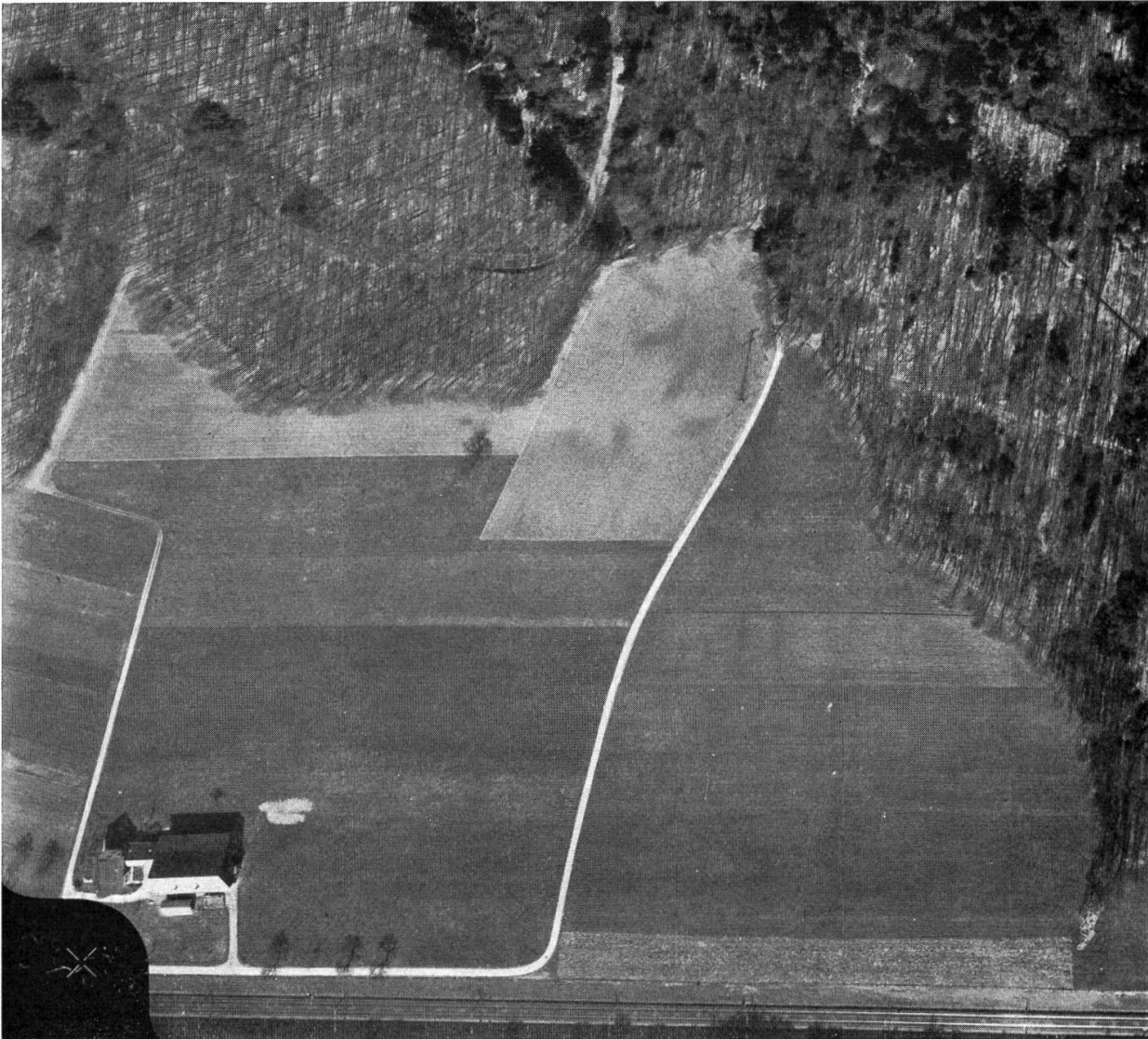
Lenzburg, Lindfeld. Flugbild des Siedlungsgeländes

Oben im Waldwinkel erkennt man die strahlenförmige Anlage des Theaters vor der Ausgrabung