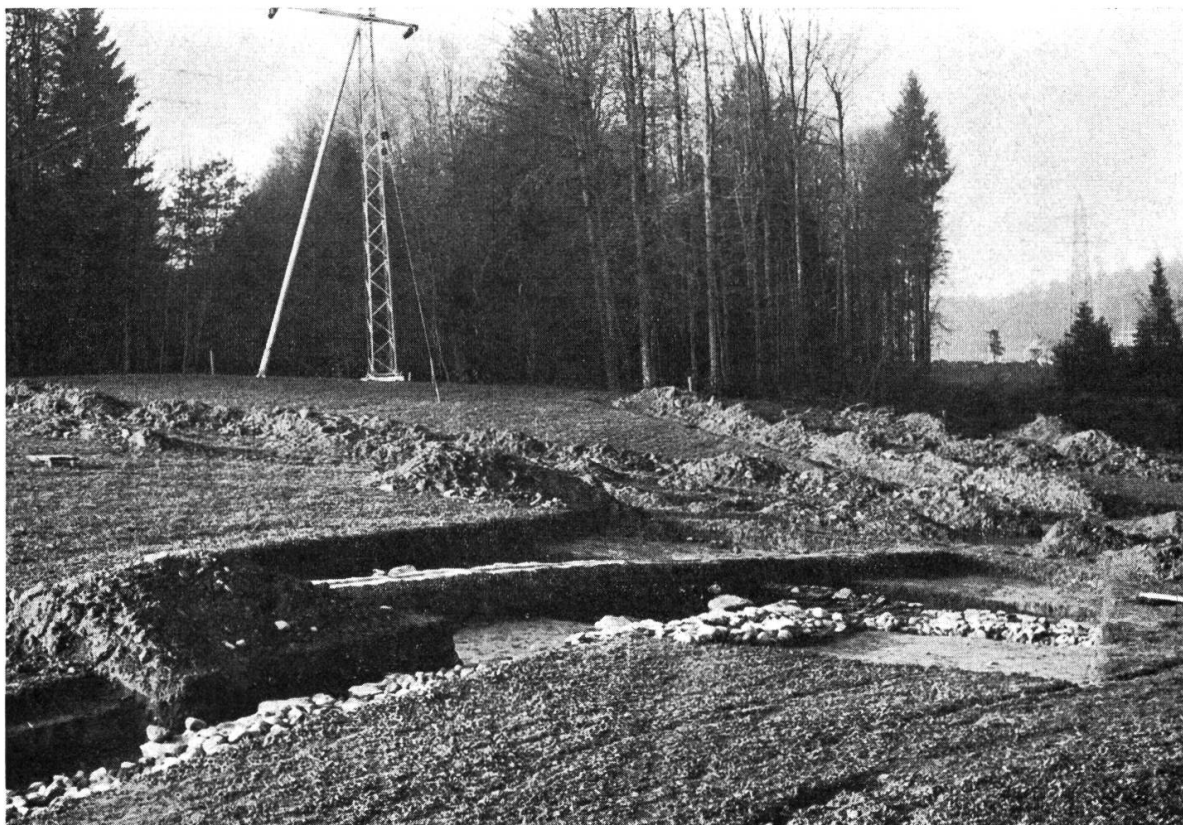
Lenzburg, Lindfeld. Das Gebiet des römischen Theaters während der Untersuchung im Spätherbst 1964