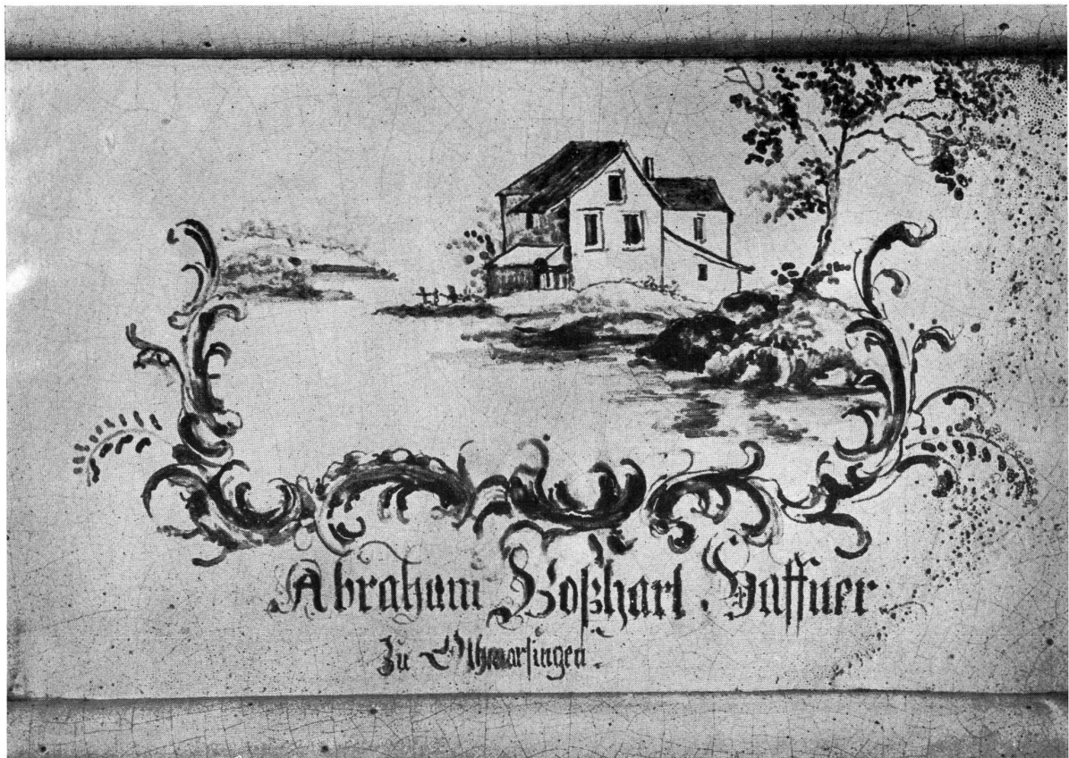
Die Kachel mit dem Namen des Hafners