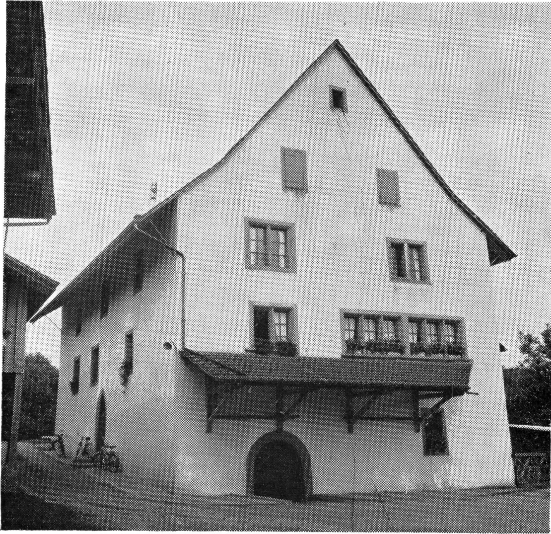
Die ehemalige Mühle von Othmarsingen