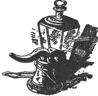
Zeichnungen von Willi Dietschi