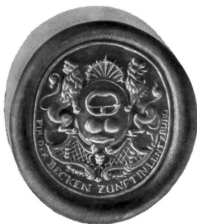
Siegel der Beckenzunft in Lenzburg