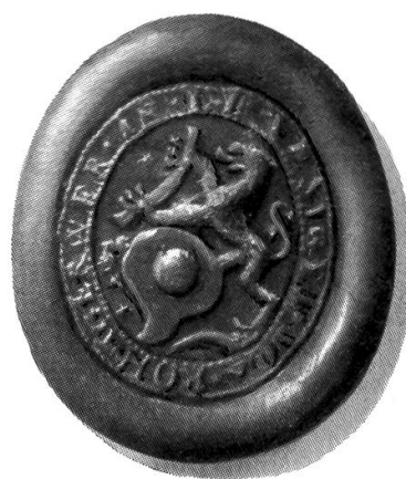
Siegel der Loh- und Rotgerber in Lenzburg