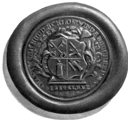
Siegel der Schlosser, Messerschmiede, Büchsen- und Windenmacher des Bezirks Lenzburg