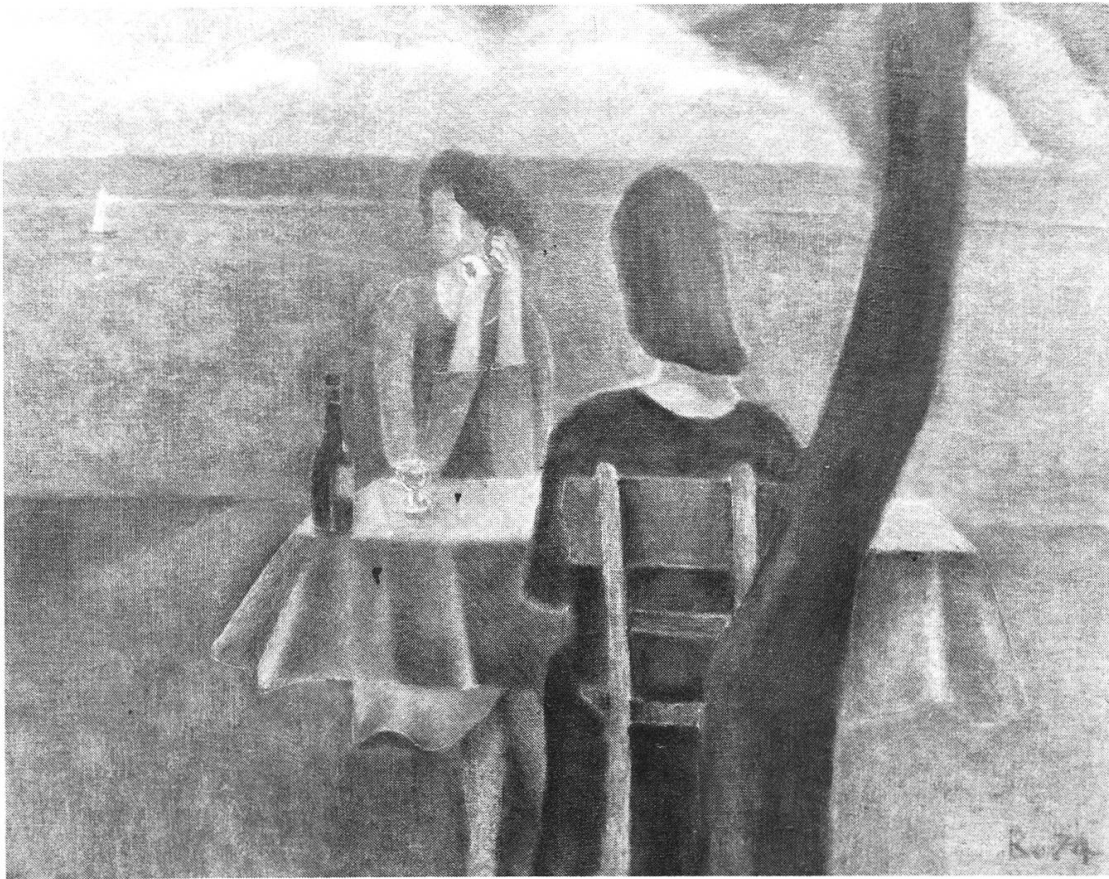
Hans-Rudolf Roth: «Die Freundinnen», Ölbild, 1974