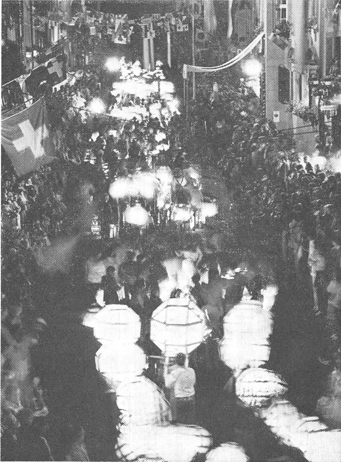
Ein gemütsbewegender Glanzpunkt der Aargauerfestnächte war der Lampionumzug der Kinder