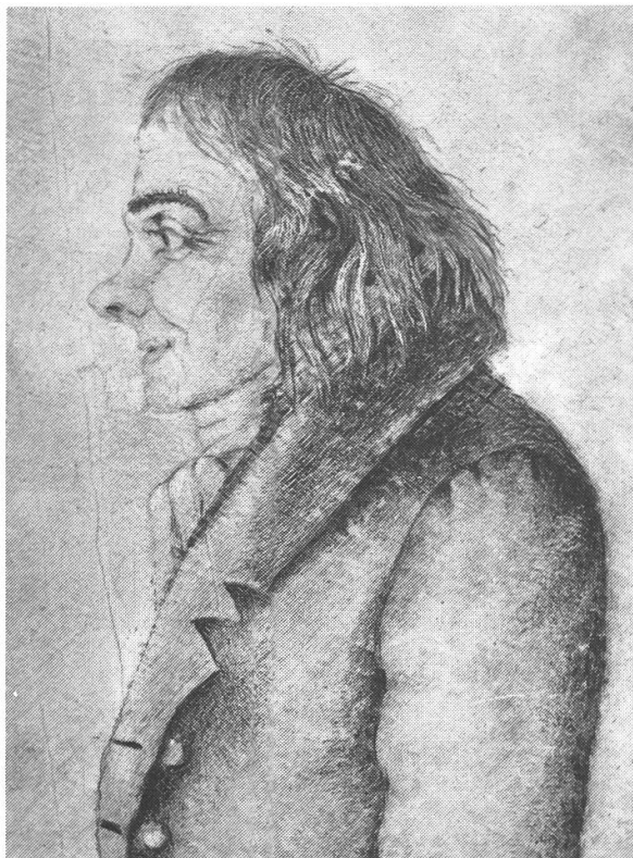
Pestalozzi Zeichnung von Oberst Friedrich Hünérwadel 1826/27 im Pestalozzianum Zürich