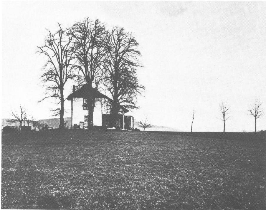
Das Gexi. Foto von A. Rohr um 1900.