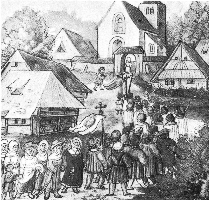
Prozession auf dem Lande; aus der Chronik des Luzerners Diebold Schilling

Doch welche Funktion kommt der St.-Wolfgangs-Bruderschaft in diesem Kontext zu? Ludwig Remling beschreibt in seinem Buch «Bruderschaften in Franken» den Begriff «Bruderschaft» wie folgt: «Bruderschaften (lassen) sich definieren als freiwillige, auf Dauer angelegte Personenvereinigungen mit primär religiösen, oft auch karitativen Aktivitäten, bestehend innerhalb oder neben der Pfarrei, wobei durch die Mitgliedschaft weder der kirchenrechtliche Status des einzelnen tangiert wird, noch sich im privaten Lebensbereich Veränderungen ergeben zu müssen.» Dabei ist es unwesentlich, ob diese Zusammenschlüsse der Selbstdarstellung einer bestimmten gesellschaftlichen Gruppe dienen oder nicht. Demonstra-