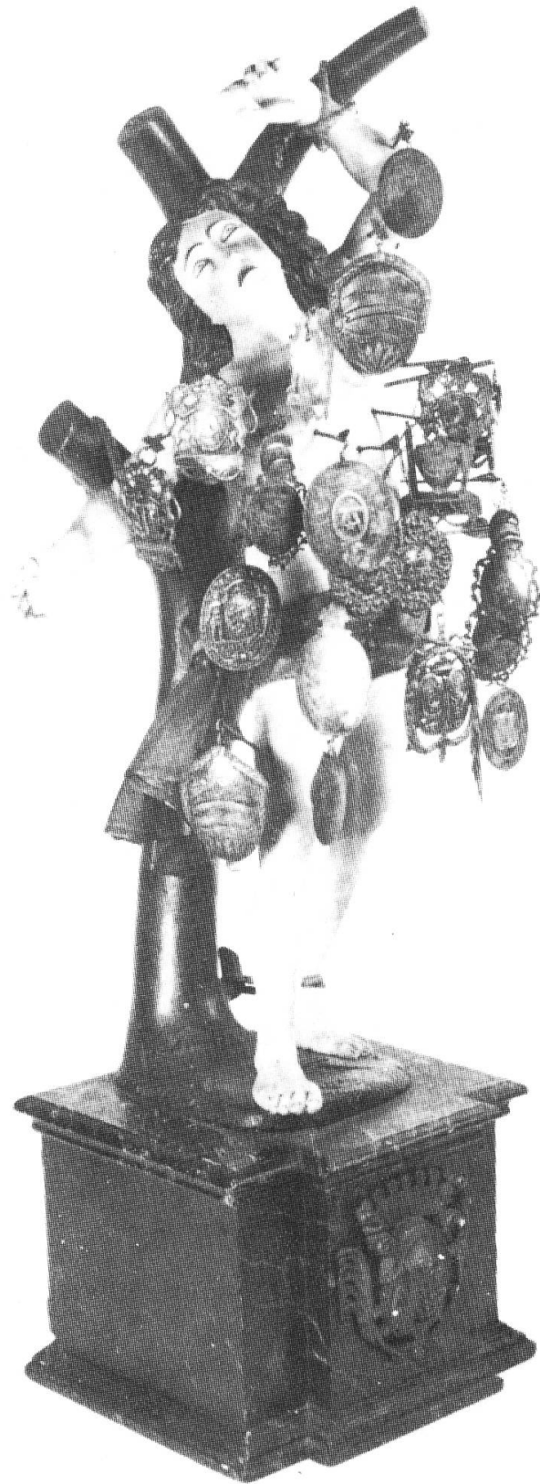
Der heilige Sebastian in seinem Leiden. An den Pfeilen hängen gestiftete Schilde. Die Holzstatue ist Eigentum der St.-Sebastians-Bruderschaft der Küssbacher Schützengesellschaft.