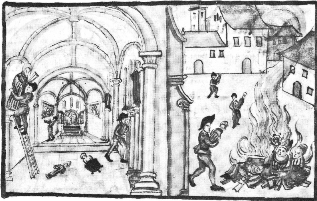
Wie die Götzen aus der Kirche getragen wurden. Bildersturm zur Zeit der Reformation; kolorierte Federzeichnung aus einer Abschrift von Bullingers Reformationsgeschichte aus den Jahren 1605/06 (Zentralbibliothek Zürich).

Sicherheit. Dem Übergang ins Jenseits – obwohl er für den mittelalterlichen Menschen nicht weniger schmerzlich gewesen sein dürfte als für uns – wurde eine andere Bedeutung zugemessen als heute. Starb jemand wohlversehrt mit den heiligen Sakramenten, hatte der Dahingeschiedene auf Erden genügend Ablass der Sünden erworben und beteten die Zurückgebliebenen für sein Seelenheil, so war ihm ein Platz im Himmel – selbst nach dem reinigenden Fegfeuer – sicher. Dem irdischen Jammertal folgte das glückliche Leben im Paradies. Diese Gewißheit wurde von den Denkern der Reformation zu Beginn der 16. Jahrhunderts fundamental angezweifelt. Für sie stand die gewachsene, religiöse Volkskultur im krassen Widerspruch zum Bibelwort, das sie als alleinige Grundlage des Glaubens betrachteten. Auch auf der Landschaft dürften die Menschen diese sich anbahnenden Änderungen wahrgenommen haben, wenn sie auch das Ausmaß und die Tragweite der Umwälzungen kaum abschätzen konnten. In Zürich und Basel wurden neuerdings reformatorische Schriften gedruckt, die Lenzburg erreicht haben dürften. Vor der Reformation gab es auch im heutigen Aargau heftige Diskussionen um theologische Fragen. Hin und wieder kam es sogar zur Störung von Predigten. 4