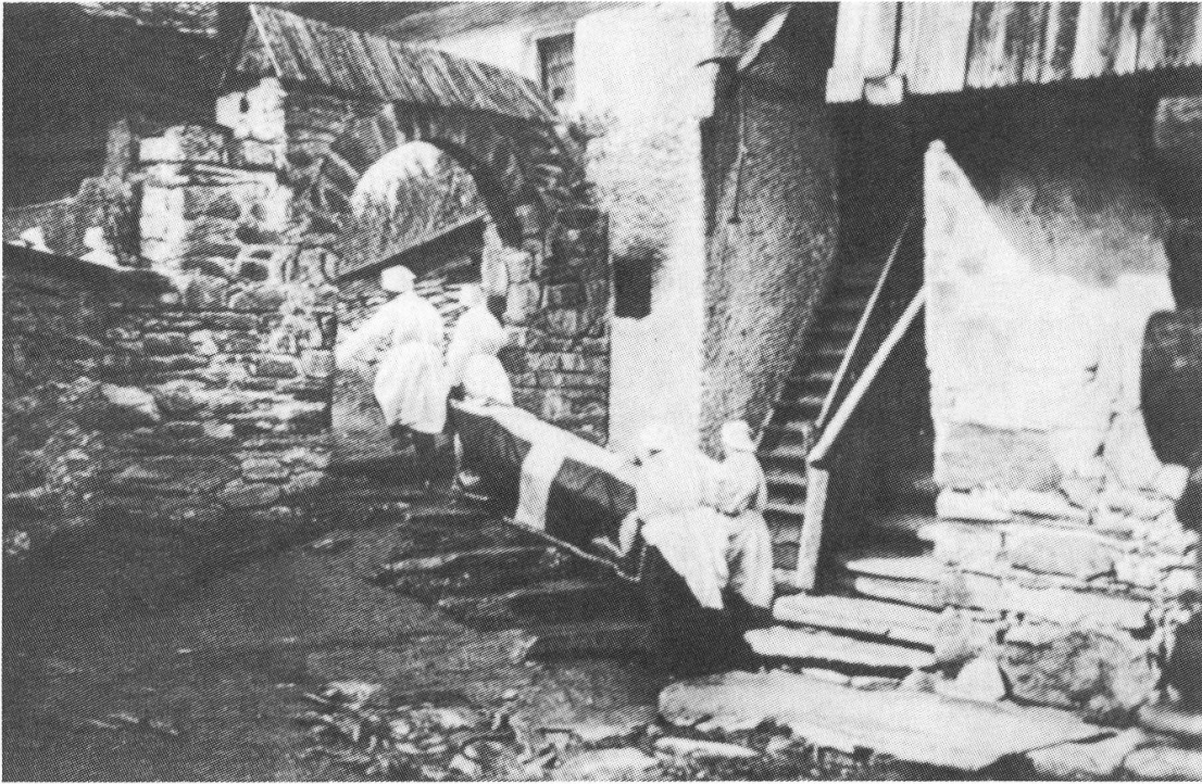
Die «Confrérie du Saint-Sacrement» (Bruderschaft der Heiligen Sakramente) aus Kippel trägt eines ihrer Mitglieder zu Grabe.