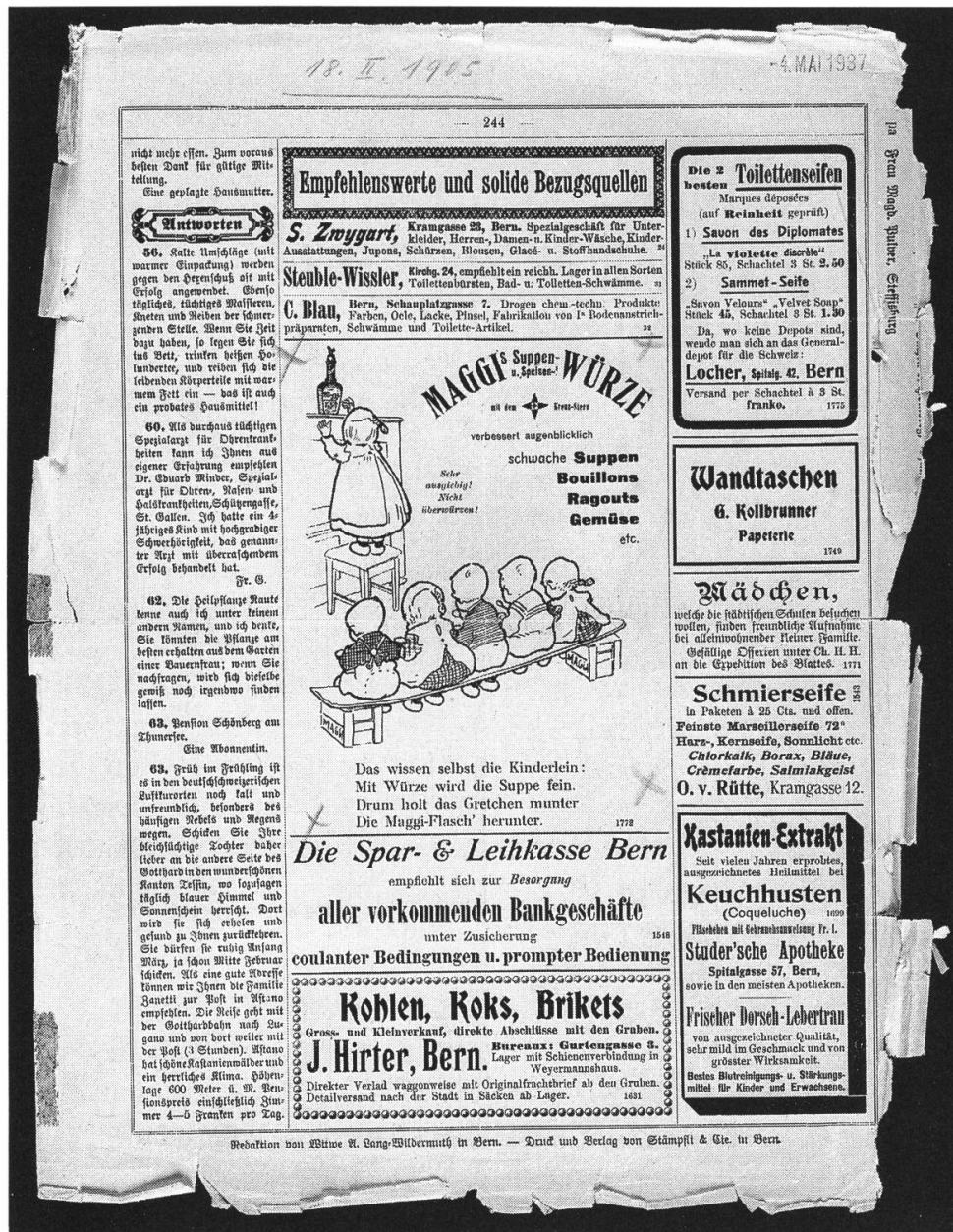
Maggi-Anzeige von 1905 mit einem Vierzeiler, den Frank Wedekind als Reclamechef von Julius Maggi in Kempththal 1887 schrieb.

Ich käme wahrlich in Teufels Küche, wollte ich hier Wedekinds Kritizismus fortsetzen, dem er auch in einem anderen, nicht von ungefähr unvoll-