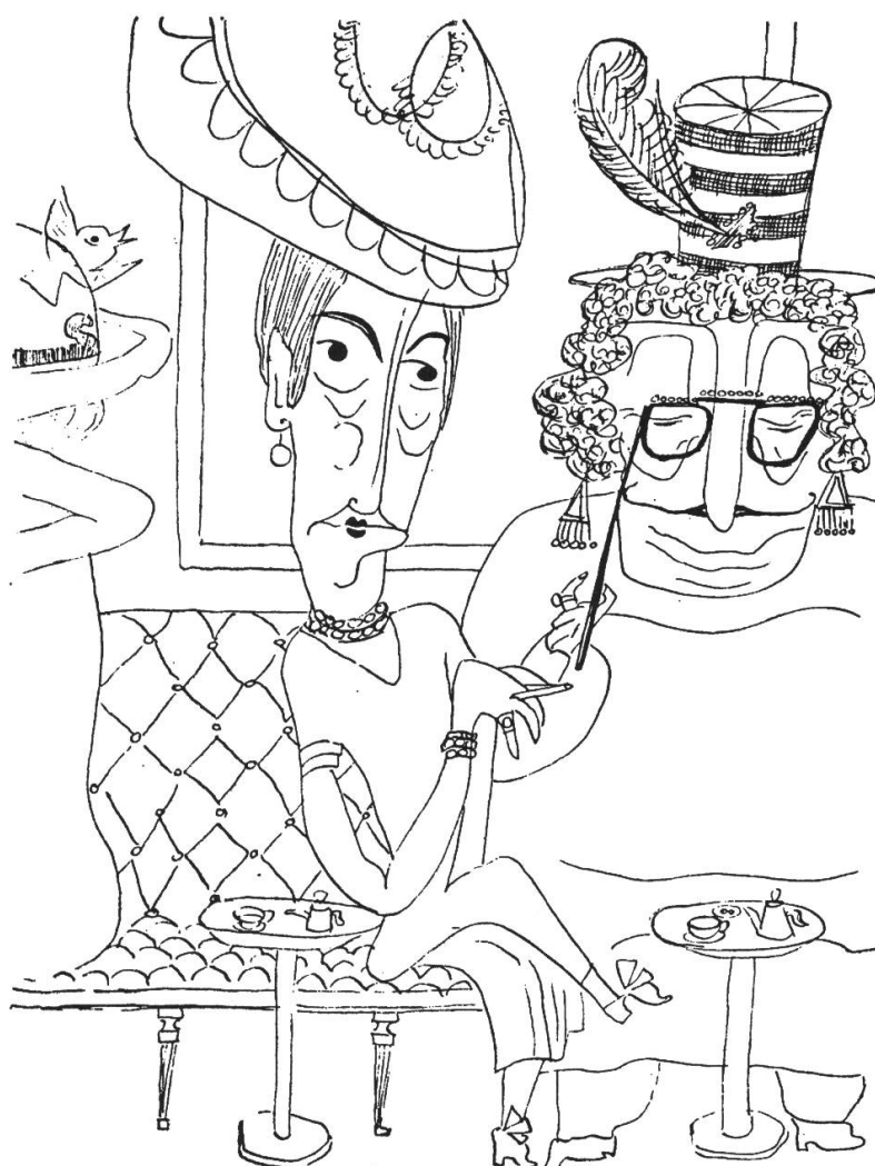
Ein Beispiel aus: «Les Grâces de chez Rumpelmayer».