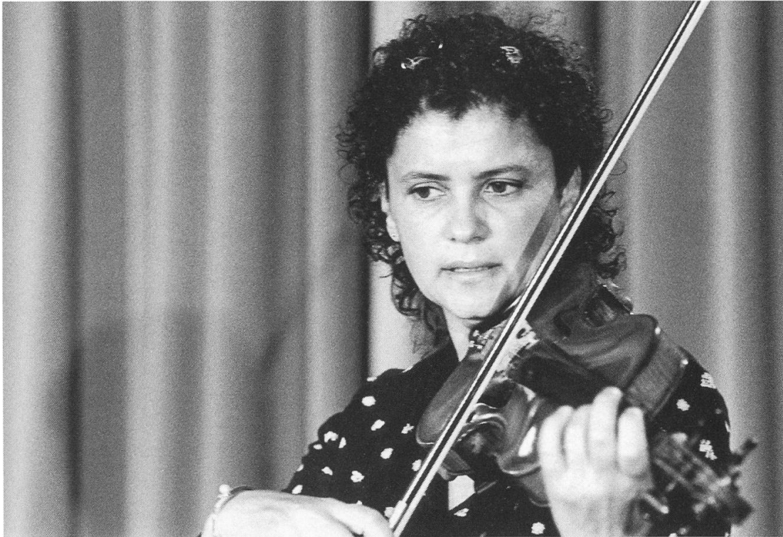
Iva Bittova: ob Stimme oder Violine – Musik als pure Magie.