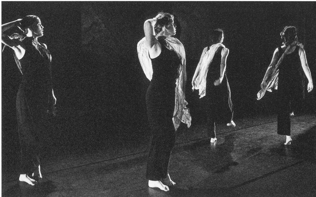
Tänzerinnen als verbindendes Glied zwischen Musik und Mode.

Die MBL `00 ermöglichten zum 17. Mal interessante Beziehungen: Zuhörerinnen und Zuhörer, Interpretinnen und Interpreten begegneten dem italienischen Gusto in Werken Bachs und Strawinskys, Surrealismus und Buffoneskerie schillerten aus den Werken von Millaud, Schulhoff und Poulenc, der Abend „Australien – Terra incognita“ entführte in musikalisch weitgehend unbekannte Gefilde. Unbekanntes neben Bekanntem galt es auch in der Klaviermusik aus Böhmen und Mähren zu entdecken und in den Werken der Familie Bach wurden im Chorkonzert neben interessanten Parallelitäten reiche Kontraste vermittelt. Ob bekannt oder unbekannt, der Reiz der MBL zum neuen Millennium lag gerade in der Begegnung, der Begegnung von Bach und Strawinsky, von Musik und Literarischem, Tänzerischem und sogar Modi-