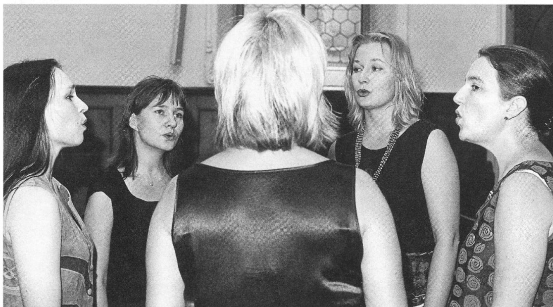
„MeNaiset“ führt in magische Welten musikalischer Trance finnisch-ugrischer Vokalmusik.