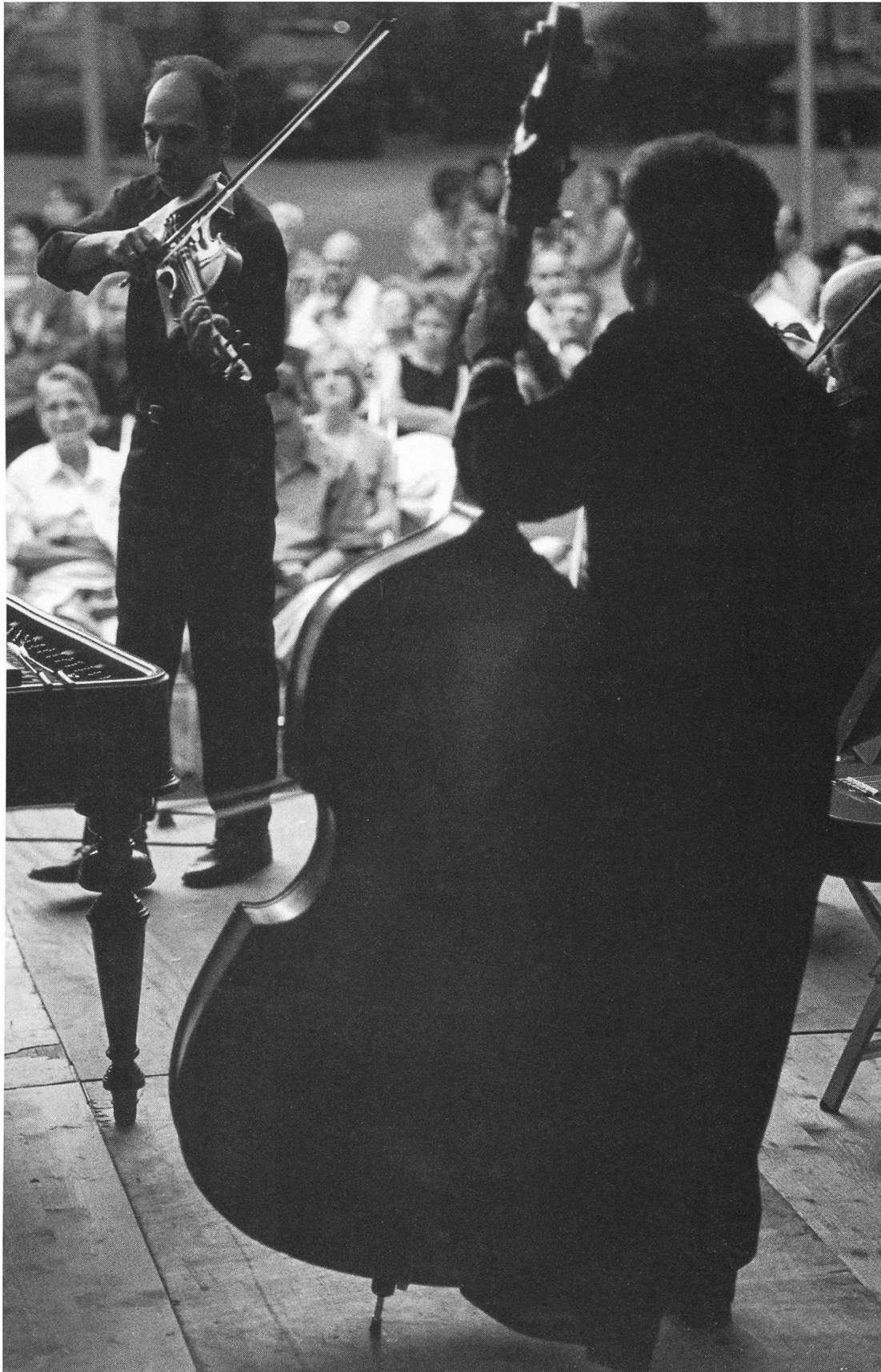
Ungarisches Volksfest auf dem Metzplatz mit dem Zigeunerensemble „Kalandos“.