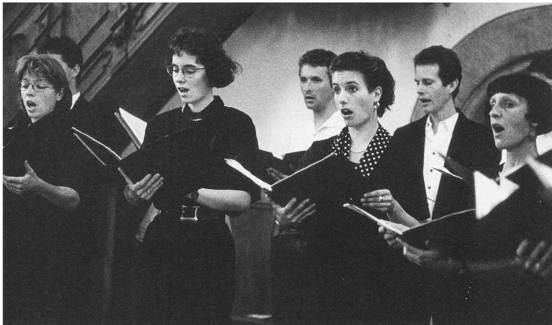
Markenzeichen des Collegium vocale: vergessene Werke grosser Meister, grosse Werke vergessener Meister und Werke von Komponisten, deren Meisterschaft vielleicht erst die Nachwelt würdigen wird.