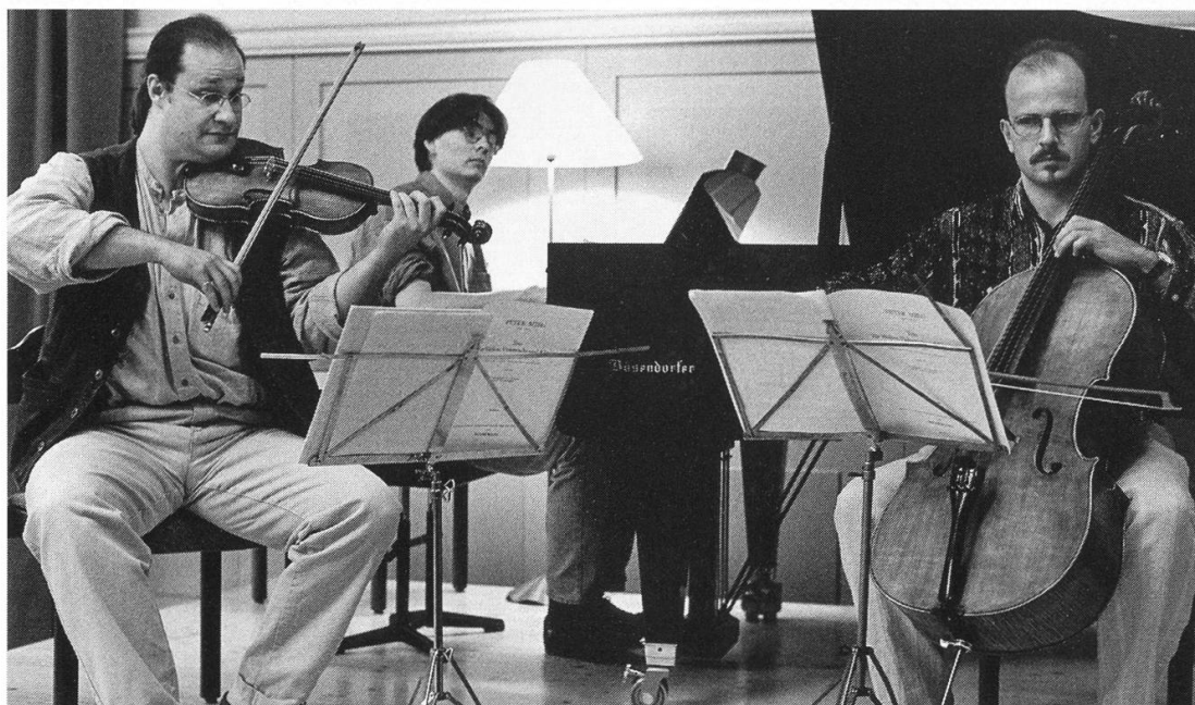
Trio Animae – wie immer animiert und begeistert.