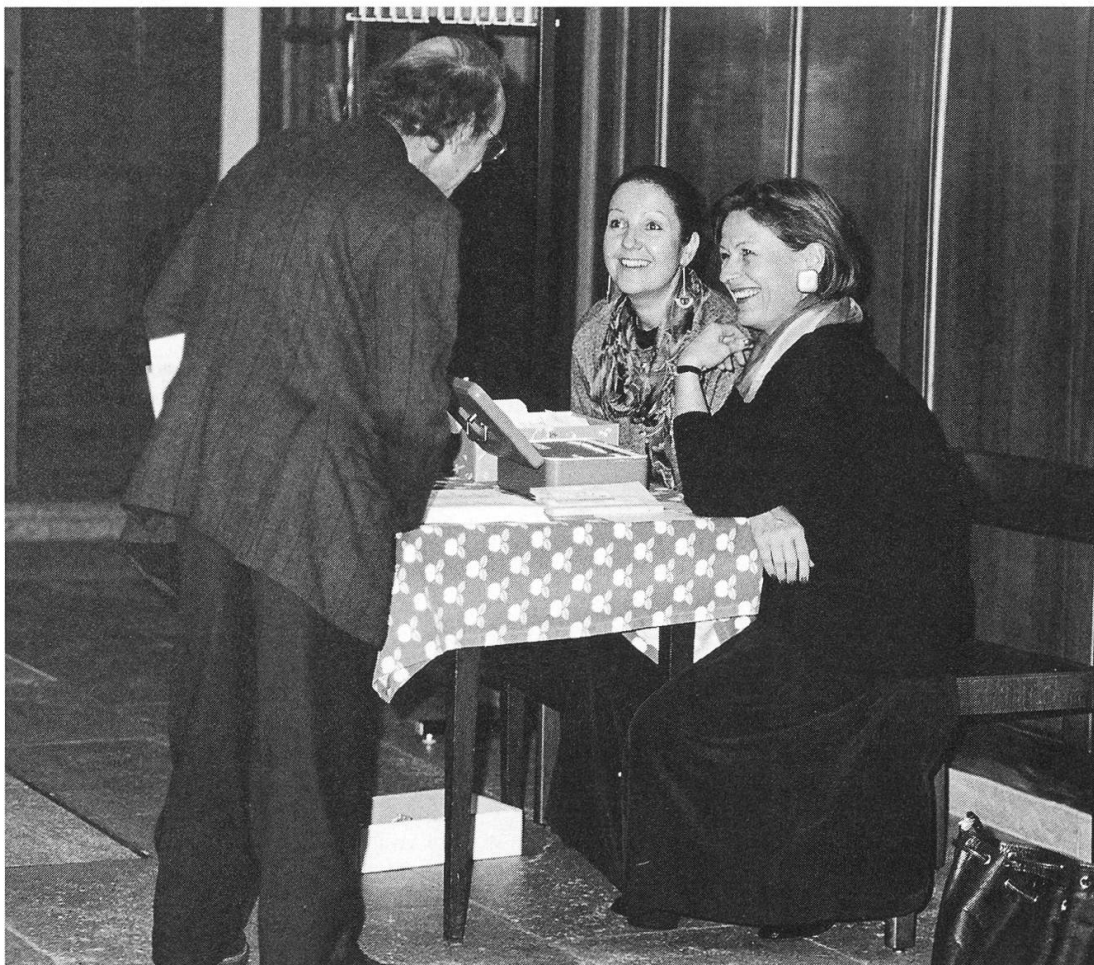
Ob da wohl die Verballhornung der „Ludi vocales“ zu „Fudi locales“ Anlass zum Lachen war?

reformierten Kirchgemeinde, deren 2. Abendmusik ins Programm eingeschlossen werden konnte. Eröffnet wurde die Veranstaltungsreihe mit „magischen Klängen und Intervallen“, Kompositionen und Improvisationen von Pierre Favre, Perkussion, und Tamia, Voice. „Pierre Favre und Tamia – nichts als eine Stimme und ein Schlagzeug, der Gesang und die Perkussion, die ältesten musikalischen Ausdrucksformen“. Einmal mehr erwies sich Tamias Stimme als Instrument und Pierre Favre als Poet am Schlagzeug – Zuhörerinnen und Zuhörer in der Stadtkirche waren ergriffen und begeistert. – Ein Streichquartett um Marlyse Capt mit dem Klarinettenisten Jürg Frey brachte im Alten Gemeindesaal dessen Streichquartett, komponiert 1988, zur Aufführung zusammen mit dem „Clarinet and String Quartet“ von Morton Feldmann. – Zum Höhepunkt der Veranstaltungsreihe wurde das Chorkonzert des Collegium vocale und instrumentale unter Thomas Baldinger. Unter dem Titel „Trauermusik“ erklangen vor einem ergriffenen Auditorium die „Quatre Motets pour un temps de pénitence“ von Francis Poulenc, der „Cantus in memoriam Benjamin Britten“ von Arvo Pärt und die „Messe de Requiem“ von André Campra.