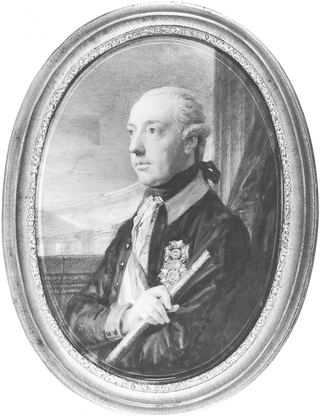
Abb. 1: Kaiser Joseph II., Miniatur von Friedrich Heinrich Füger, 1784 (Historisches Museum der Stadt Wien, Inv.-Nr. 132.646)