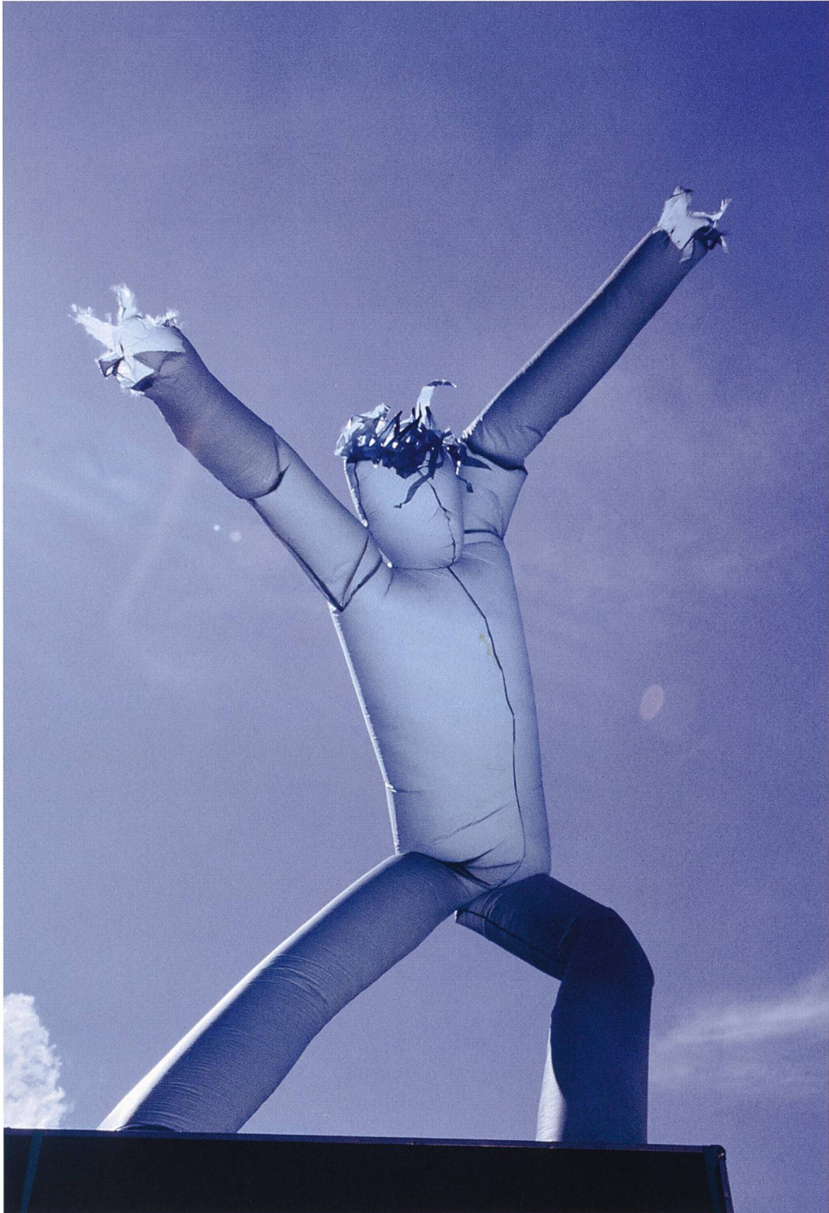
Der Traum- und Nachttänzer von LBC (Lenzburg City)