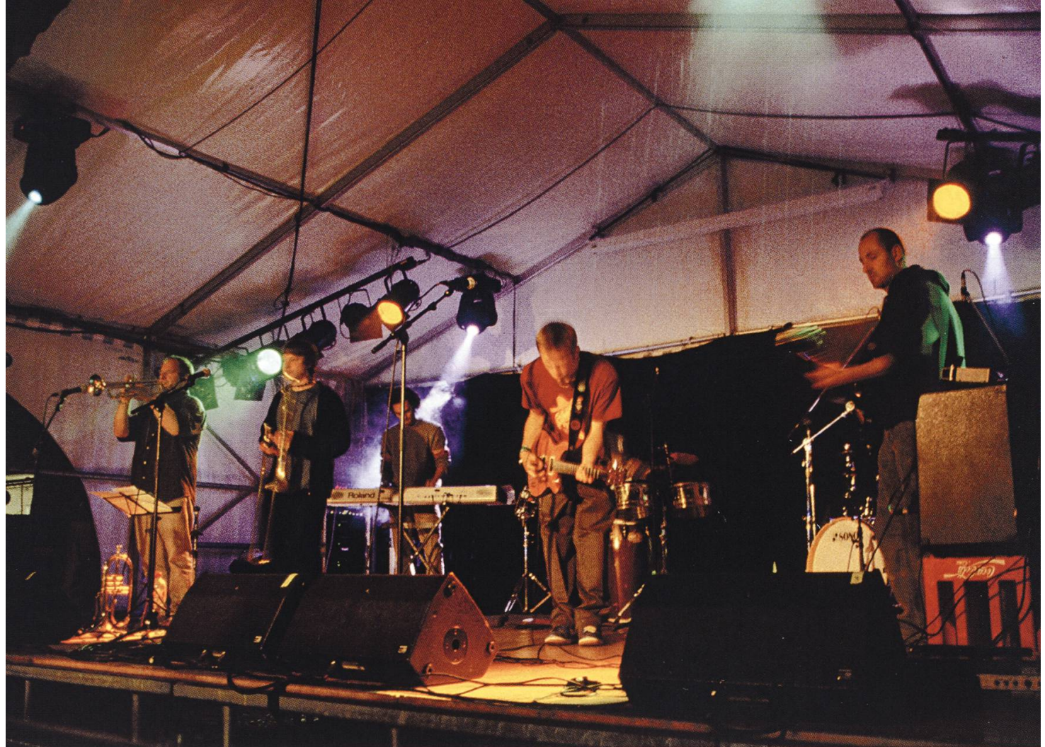
Mighty Roots, eine Reggae-Band aus der Region