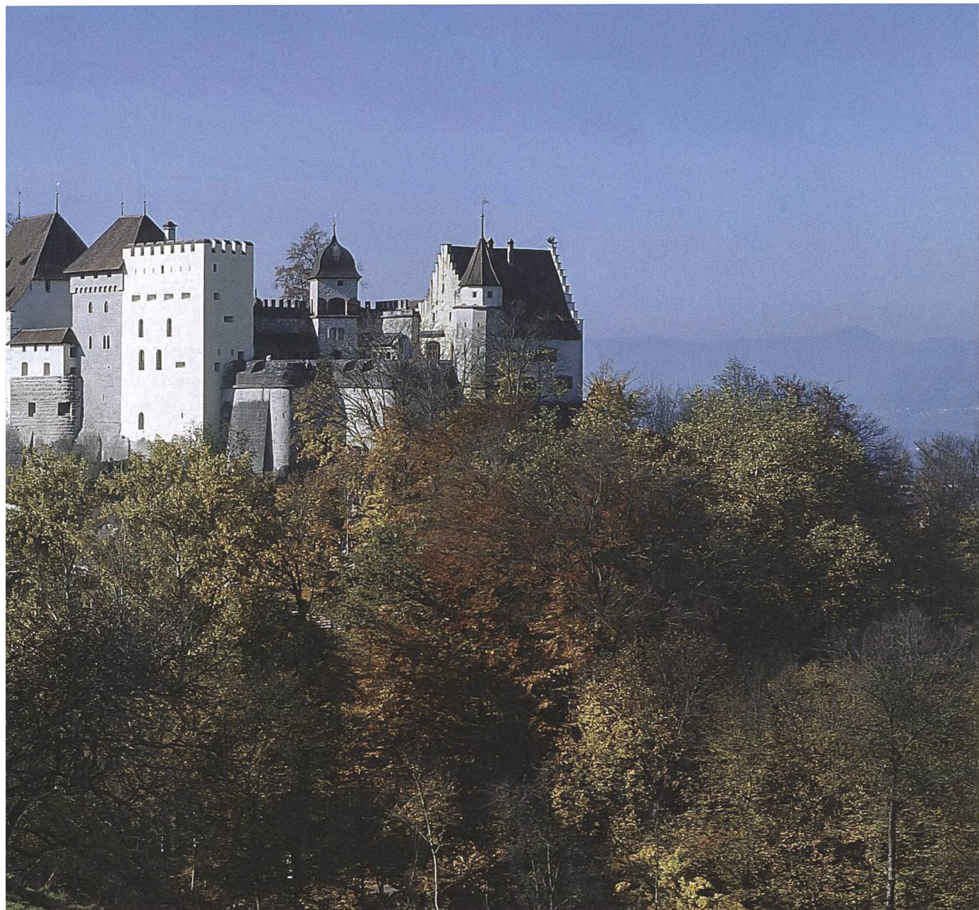
Seit 50 Jahren gehört Schloss Lenzburg der Öffentlichkeit.

Der Schlosshof seinerseits übte seinen Reiz auf die Besucher aus und bot einen stilvollen