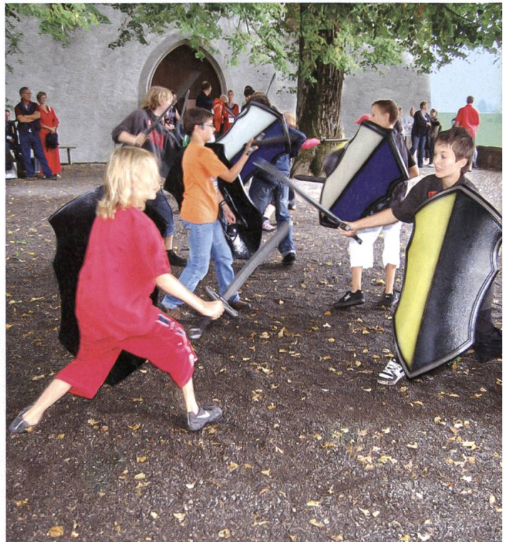
Ritterspiel mit Schwert und Schild.

Kurz nach Mittag, am 6. September 2008, fiel der Auktionshammer: Schloss Lenzburg