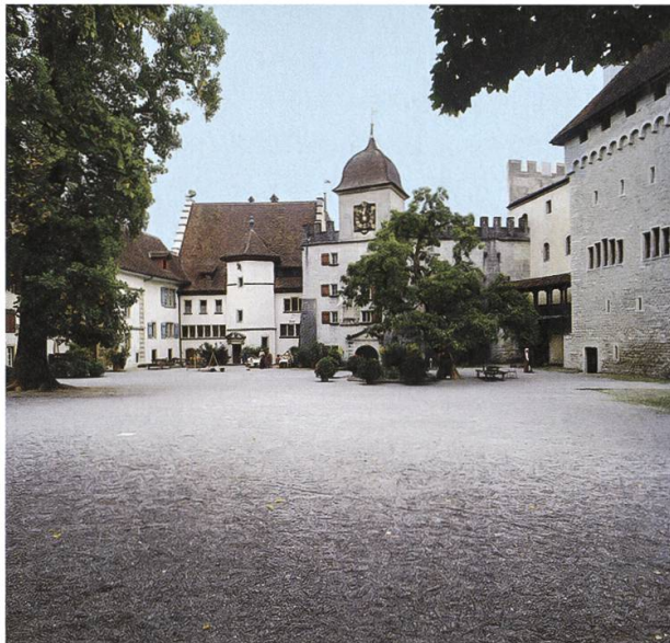
Der neu gestaltete Schlosshof.

Die Differenzen mit dem Stiftungsrat wurden Anfang 1959 in einer Sitzung mit deren Präsident Dr. Markus Roth besprochen. Der damalige Stadtschreiber verwies auf einen Anlass der «AMAG», «welcher als faux-pas zu bewerten sei». Auf dem Schloss dürften «keine leichtgeschürzten, rauschenden Feste» gefeiert werden, das gelte auch für die «Freunde», welche im übrigen bezüglich ihrer «gedeihlichen Wirksamkeit ihre Existenz noch nicht genügend bewiesen hätten». Man könnte die Wedekind-Stube mit einem Werk des Dichters einweihen mit gesellschaftlichem Anlass, der «ja nicht bis morgens sechs Uhr zu dau-