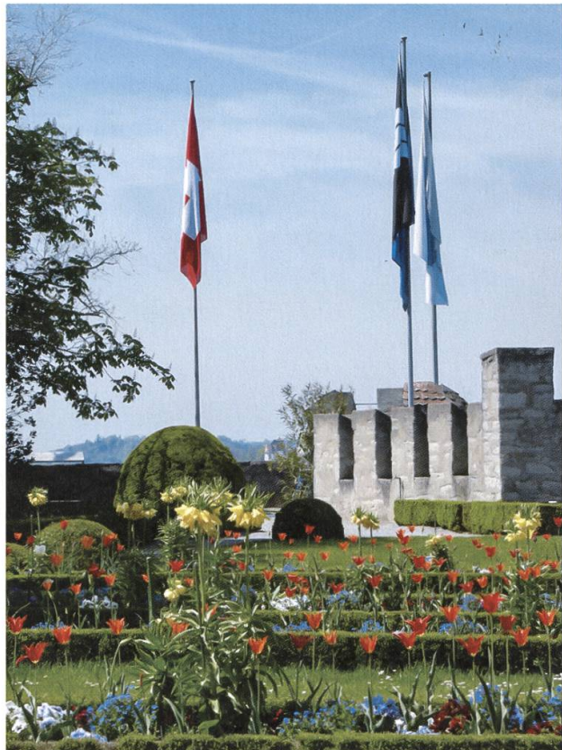
Die von Wind und Wetter arg strapazierten Fahnen wurden von den «Freunden» mehrmals ersetzt.

Beim 20-Jahr-Jubiläum 1978 stand die Geburtstagsfeier, mit Apéro im Schlosshof, köstlichen Kulinariken aus dem Hotel Haller und einer Tanz-Party, im Vordergrund der Aktivitäten, welche 242 Teilnehmer genossen. Und erstmals waren bei den «Freunden» freundliche Töne betreffend der Schloss-Sanierung zu hören. Präsident Paul Steinmann verwies auf die sozusagen einstimmige Gutheissung der Kreditvorlage von 9,25 Millionen im Lenzburger Einwohnerrat und durch den Aargauer Grossen Rat,