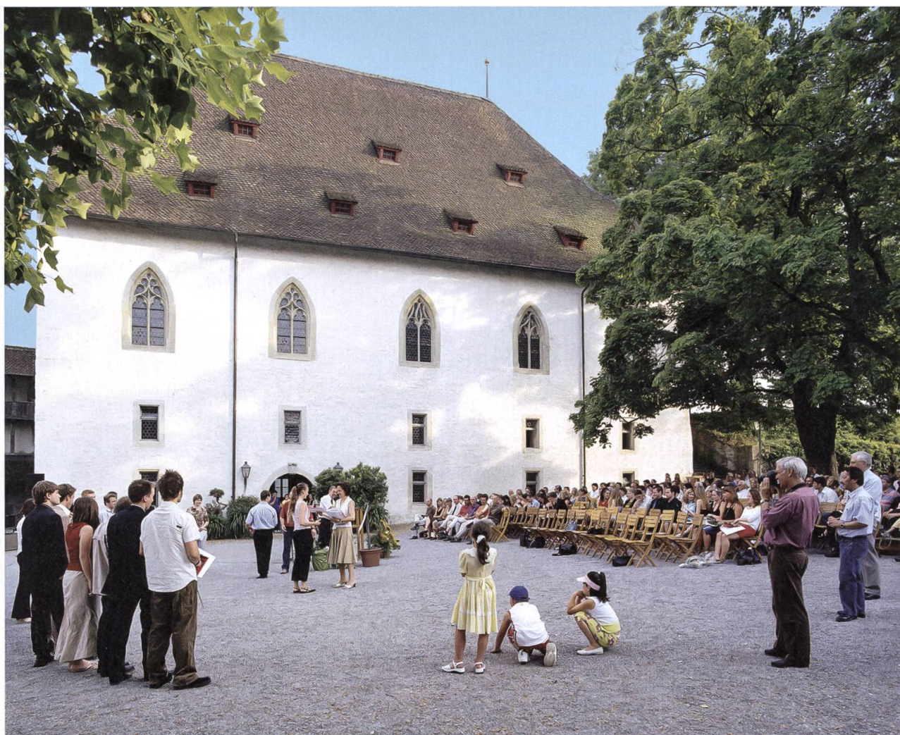
Die traditionelle Jugendfest-Serenade wird seit Jahren von den «Freunden» finanziell unterstützt.