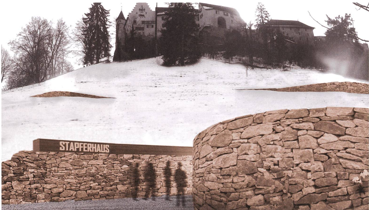
Vision: Unterirdische Ausstellungshalle für das Stapferhaus im Schlossberg mit Lift zum Schloss.