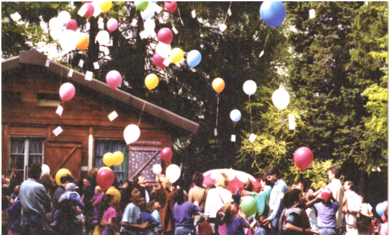
Am letzten Tag auf der Spitzcheri mischten sich Fröhlichkeit und Wehmut über den Abschied.

auf dem Spielplatz. Das Abenteuer Abenteuerplatz schien, kaum begonnen, schon zerronnen. Aber der Elternverein gab nicht so schnell auf: Im August wurde eine Petition an den Stadtrat für den Aktivspielplatz gestartet. Schliesslich einigte man sich mit den Anwohnern auf eine «friedliche Koexistenz», die Baracke konnte erstellt werden und der Aktivspielplatz, wie er fortan genannt wurde, konnte sich dank grossem Einsatz zahlreicher vorwiegend freiwilliger Helferinnen und Helfer im ursprünglich gewünschten Sinne und Ausmass kontinuierlich weiter entwickeln.