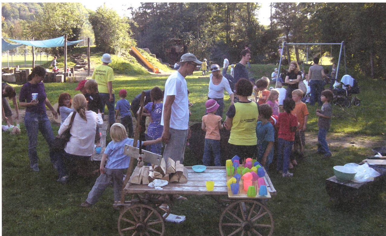
Der am Stadtrechts-Jubiläum 2006 eingeweihte neue Spielplatz Wilmatten erfüllt alle Wünsche.

den als Lagerräume, Feuerstelle, «Freiämterhütte») mit benutzt werden kann und welcher vom Stadtbauamt unterhalten wird, fand am 20. August 2006 statt. Den Rahmen dazu gab das grosse Lenzburger Fest zum Jubiläum 700 Jahre Stadtrecht