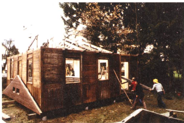
Trotz anfänglichem Widerstand konnte die Baracke schliesslich aufgebaut werden.

Voller Elan gab eine ausserordentliche Versammlung im Frühling 1979 grünes Licht für das Konzept zur Durchführung eines Versuchsbetriebes auf dem Spielplatz an Mittwoch- und Samstag-Nachmittagen sowie Ganztages-Aktionen in den Sommer- und Herbstferien. In verschiedenen Bereichen sollten diverse Aktivitäten wie Bauen, Gestalten, Spielen mit den Elementen Wasser und Erde, Bewegungs- und Geschicklichkeits-, Beziehungs- und Nachahmungsspiele usw. angeboten werden.