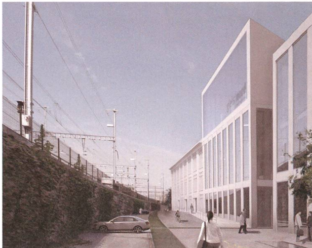
«Stadtauge» als Blickfang des neuen Quartiers.