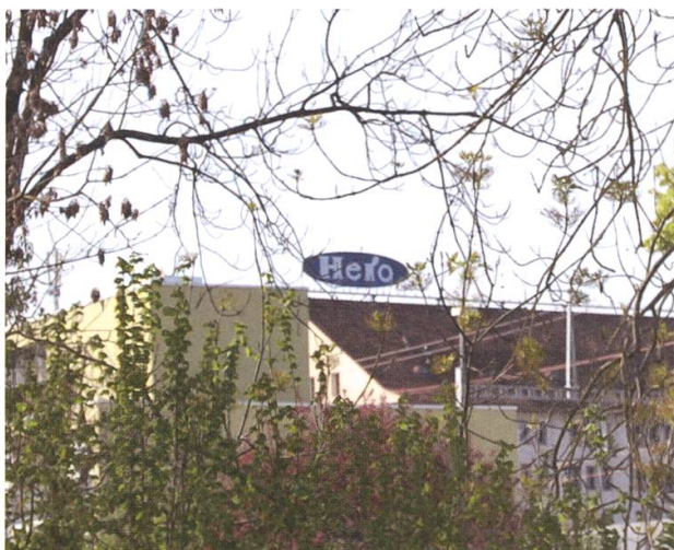
Das Hero-Logo dominierte das Stadtbild.

«Hero ist Lenzburg und Lenzburg ist Hero» – hoffentlich bleibt dabei.