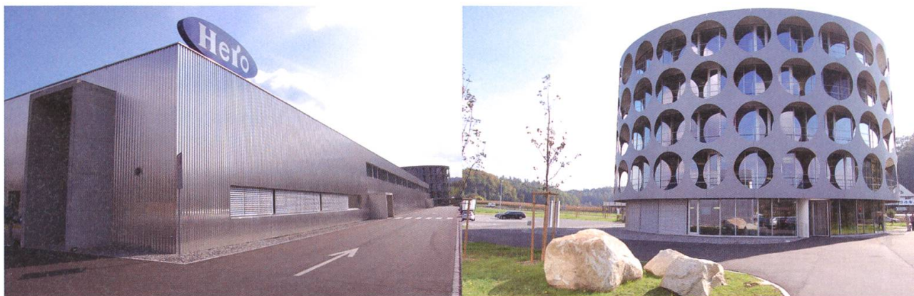
Die Architektur der Hero-Bauten Fabrik und Firmensitz im Hornerfeld symbolisiert, was drinnen passiert.

Das Konzept ist nicht neu. Industriebauten als architektonische Markenzeichen – neu-deutsch «Corporate Identity» – gab es früher schon: In Lenzburg die Malaga-Kellereien, in Rheinfelden das «Feldschlösschen» sind Beispiele dafür, wie Firmensitze auf Briefköpfen und Etiketten für unverwechselbare Marketingzwecke gebaut und verwendet wurden. Die Hero als traditionsbewusste Firma griff für ihren Neubau auf der grünen Wiese auf das historisch bewährte Rezept zurück.