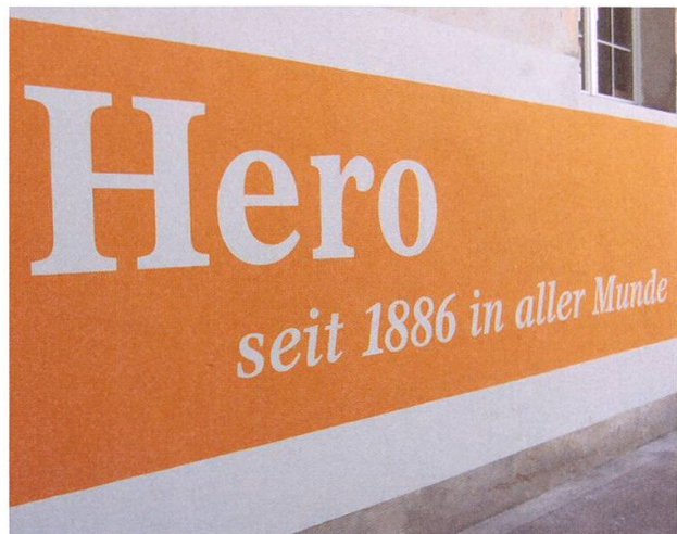
Im Seifi-Haus wurde für die Hero-Sonderausstellung Raum für das Museum Burghalde geschaffen.

In die Gegenwart führt eine aktuelle Produkteschau, welche die Entwicklung des Nahrungsmittelkonzerns zu Convenience-Produkten belegt. So wird von den Ursprüngen bis heute der Wandel von Kundenbedürfnissen und Ernährungstrends, von Produktpaletten und Vermarktungsstrategien dokumentiert. Das Museum Burghalde freut sich, mit der Sonderausstellung über die Geschichte der Idee und der Marke Hero ein wichtiges Stück Schweizer Industriegeschichte der Öffentlichkeit präsentieren zu dürfen. Eine Referenz an die Weltfirma, welche dem Standort Lenzburg seit 125 Jahren treu geblieben ist.