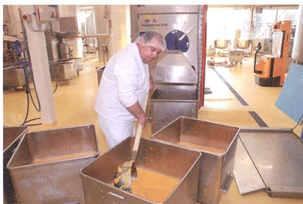
Die Früchte werden fürs Kochen bereit gestellt.