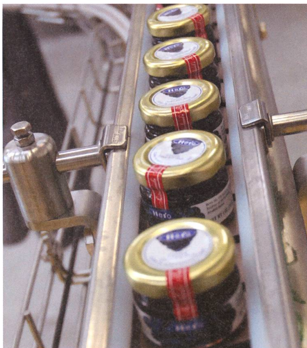
Das Kompetenzzentrum für Konfiportionen.