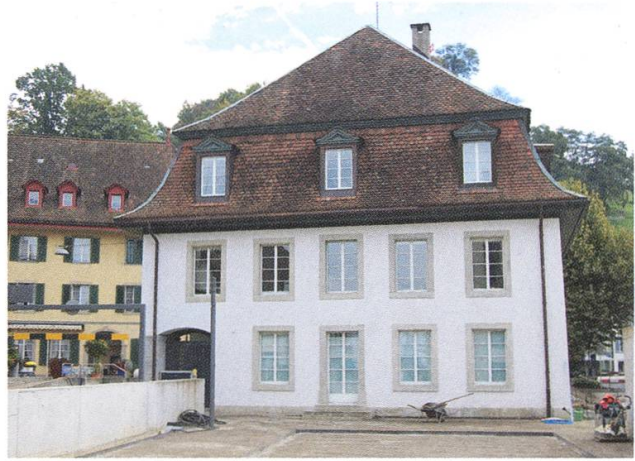
Das Försterhaus, von Anbauten befreit.

Ein wichtiges Ziel für die Überbauung Eisengasse war es, eine hohe, den heutigen Bedürfnissen entsprechende Wohnquali-