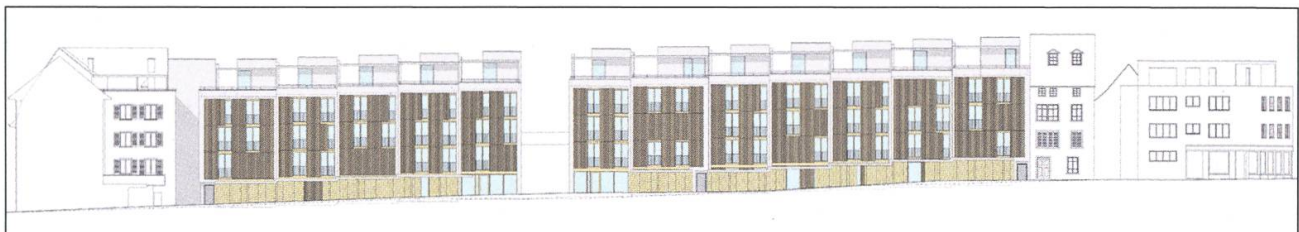
Die Überbauung Sandweg-Eisengasse im Schnitt und die Fassaden zu Promenade und Eisengasse.