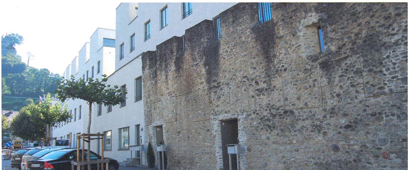
Die Symbiose von sanierter Stadtmauer und moderner Überbauung, Situation ab 2012.