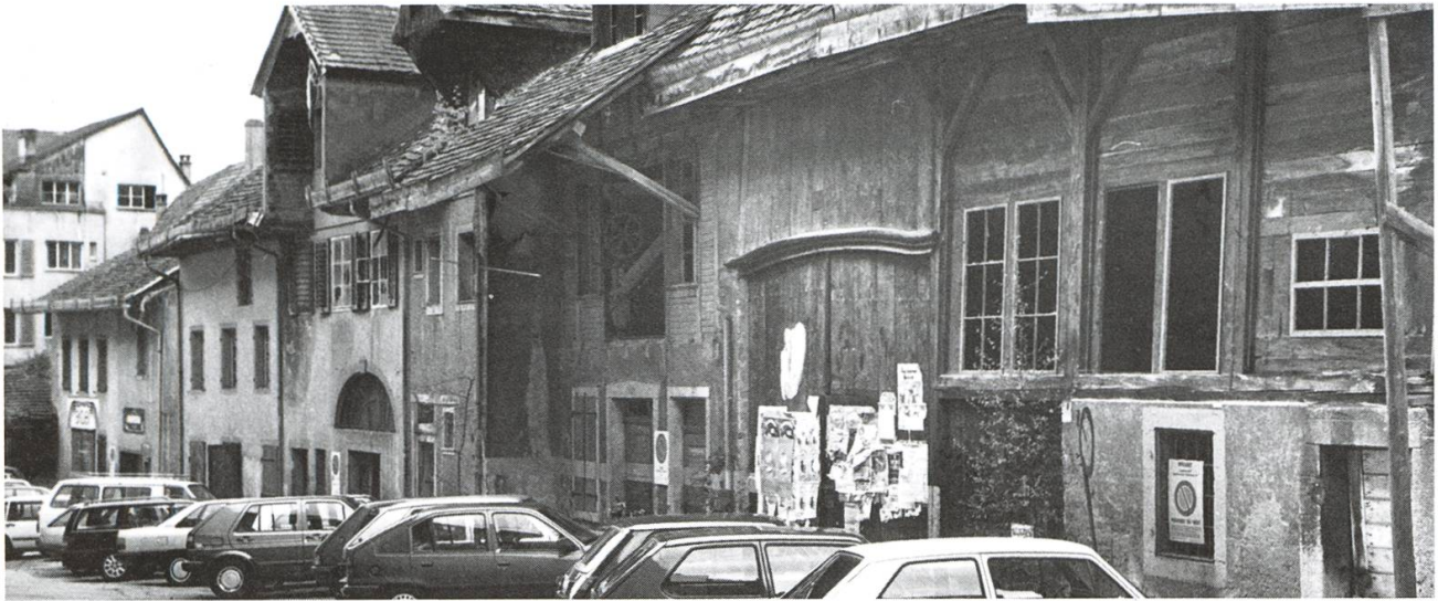
Der jahrzehntelange «Schandfleck», die zerfallenden Häuser an der Eisengasse, wurden 1994/95 abgebrochen.