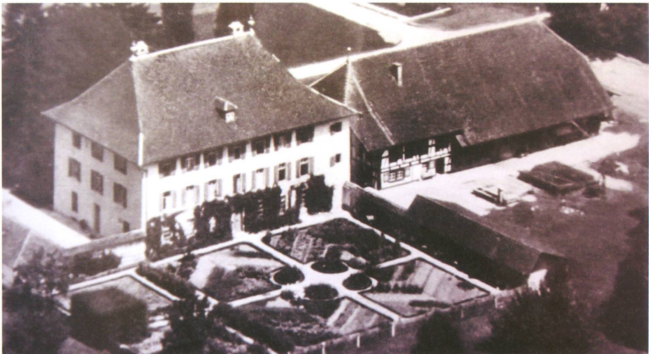
Luftaufnahme des Neuhauses (Brutel-Gut) mit prächtiger Parkanlage um 1950.

Das Neuhaus wurde ca. 1750–1758 als repräsentatives Herrschaftshaus mit barockem Ziergarten und Landwirtschaftsbetrieb errichtet. Vermutlich hat Etienne Brutel den Bau begonnen. Das Anwesen liegt nahe der anderen Brutel-Häuser Schlössli und Haus Im Guet an der alten Zürich-Bern-Strasse. Ein Stundenstein zeigt die Distanz zu Bern an (15 Stunden). Das Neuhaus blieb bis 1971 in Familienbesitz. Der zweitletzte Brutel Rudolf Friedrich veräusserte das Mobiliar und verkaufte das Gut schliesslich an Spekulanten. In der Folge verwahrloste es, die qualitätvolle Innenausstattung fiel Diebstählen und Vandalismus zum Opfer. 1980 erwarb die Stiftung Brutelgut das Anwesen und stellte nach einer umfassenden Renovation die Räume der Rudolf Steiner-Schule Aargau zur Verfügung. Das ehemalige Wirtschaftsgebäude wurde abgesehen von der Fachwerkfassade beim Wohnteil stark umgebaut. Auf der Dachunterseite befindet sich das aufgemalte Wappen der Brutel.