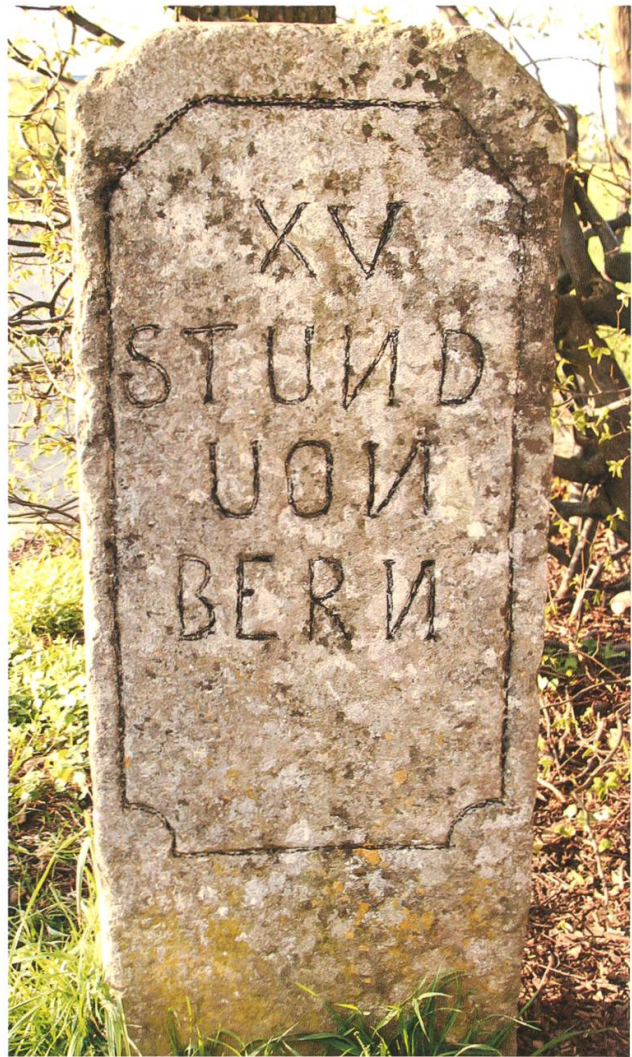
Nach dem Vorbild der römischen Meilensteine: Die Wegmarke beim Brutel-Gut.

Im Kanton Aargau sind nur zwei solche Steine erhalten geblieben, interessanterweise nahe beieinander: Nebst dem Exemplar in Schafisheim befindet sich bei