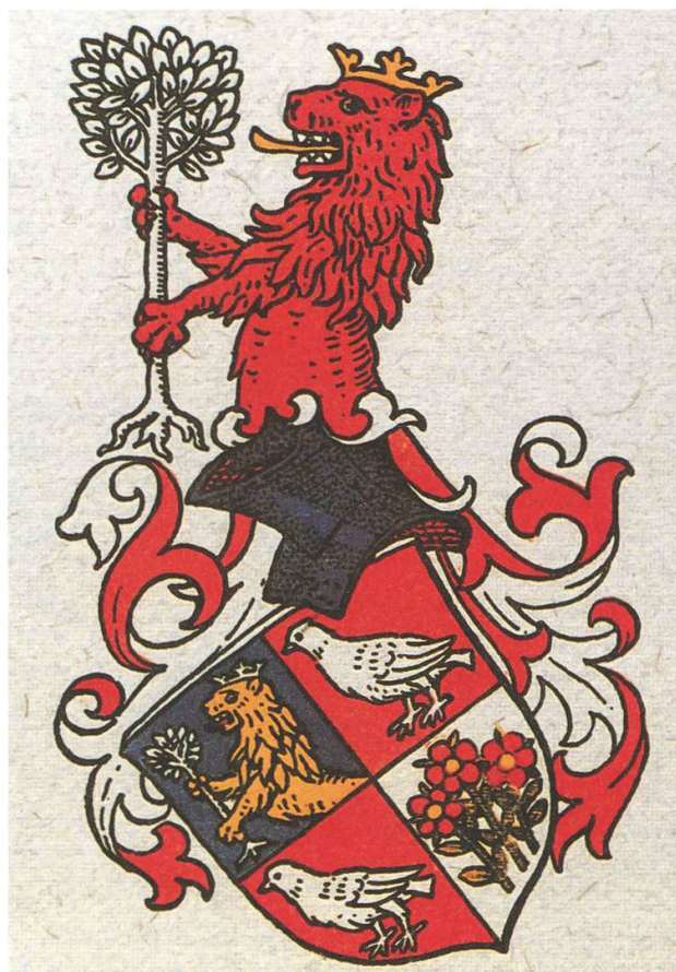
Das Familienwappen auf der Dachunterseite des Brutel-Gutes (heute Rudolf-Steiner-Schule).