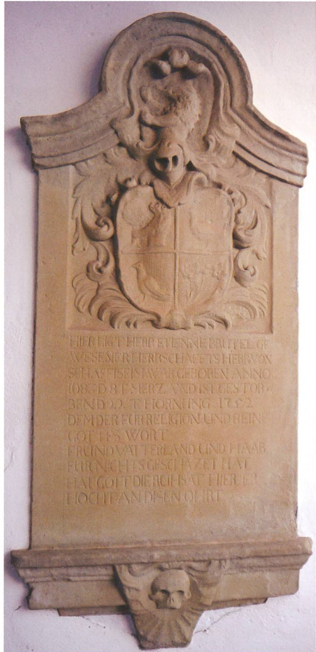
Epitaph für Etienne Brutel (1683–1752) beim Kirchenportal auf dem Staufberg.

schrieben. Die Kirche Staufberg war ihre Kirche. Etienne Brutel (1683–1752) wurde hier bestattet, eine Gedenktafel hängt rechts des Kirchenportals. Mehrere seiner Enkel wurden auf dem Staufberg getauft. Eine Tafel an der Aussenseite des Kirchenchors erinnert an seine angeheiratete Enkelin Anna Catharina, geborene Stettler (1769–1847).