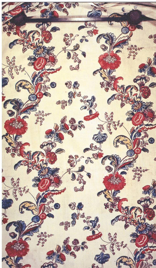
Indienne-Druck Schürze (Detail) Baumwolle (1750–1800). Schweizerisches Landesmuseum