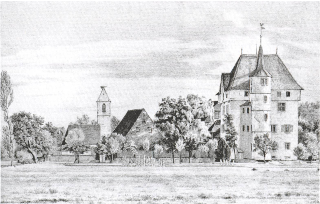
Schloss Schafisheim mit Scheune und Kirche. Zeichnung von R. Urech, 1856. Kant. Denkmalpflege Aargau

Das Hugenottenkreuz besteht aus einem Malteserkreuz mit Perlen, einer Krone sowie der Taube als Symbol des Heiligen Geistes. Die Krone symbolisiert Märtyrertum wie auch (in der liliengeschmückten Form) Treue zum König.