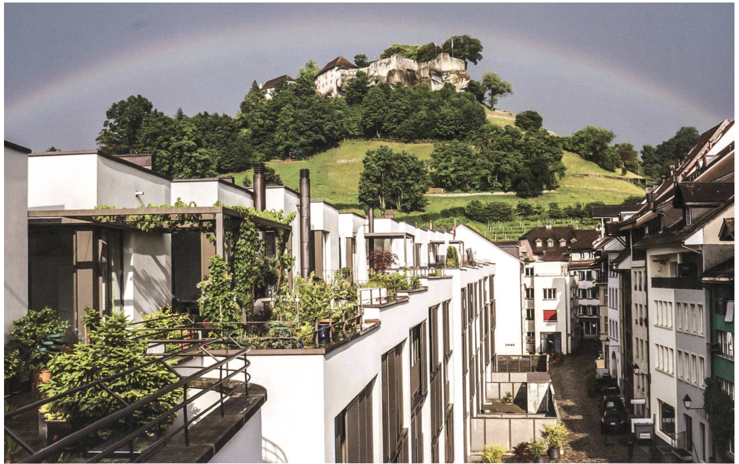
Mit Schloss und neu gebauter Häuserzeile ist Lenzburg seit Jahrhunderten unverkennbar.