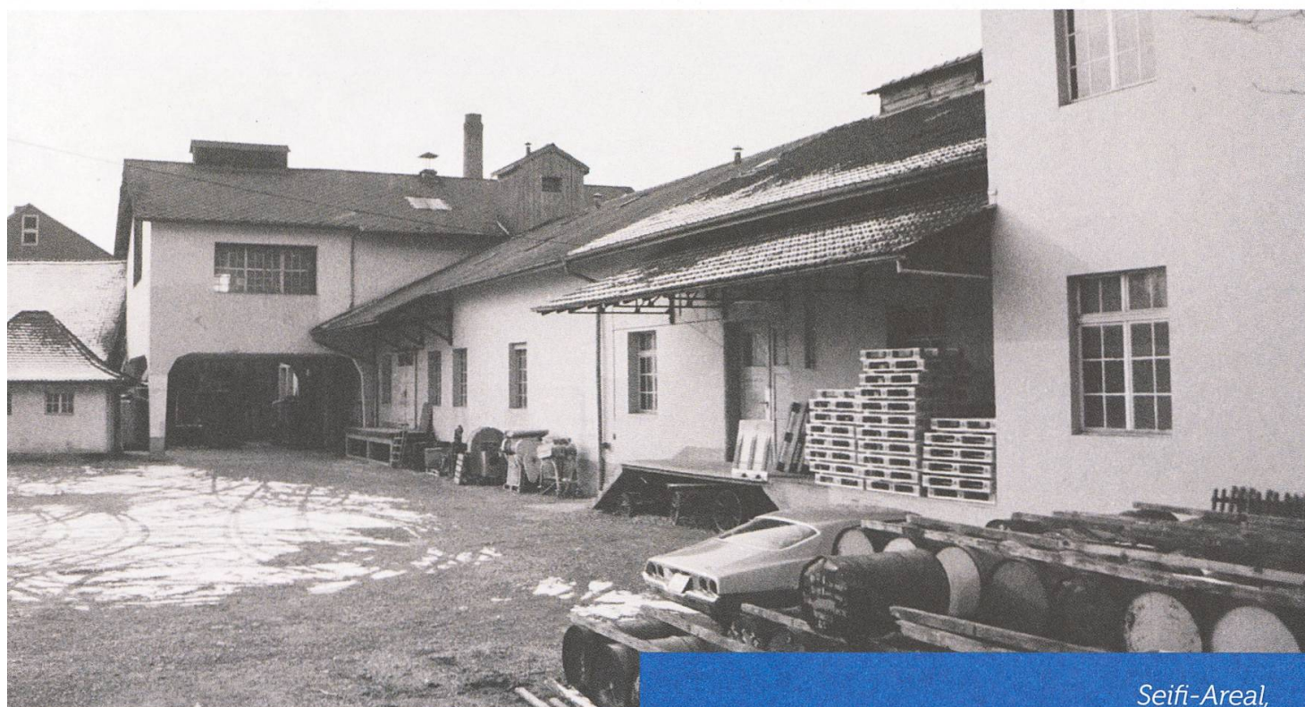
Seifi-Areal, Richtung Stadtgässli