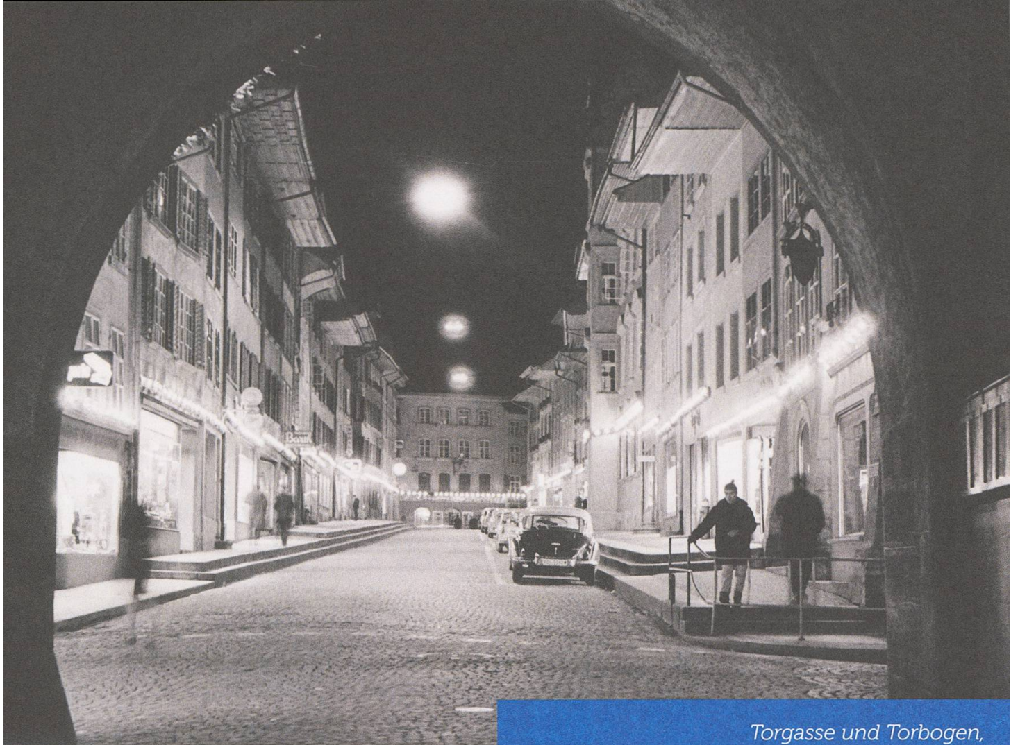
Torgasse und Torbogen, Richtung Rathausgasse