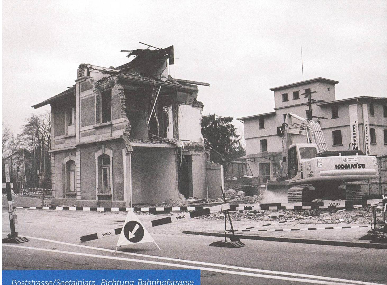
Poststrasse/Seetalplatz, Richtung Bahnhofstrasse (alter Bahnhof Stadt und «Schneeflockenhaus»)