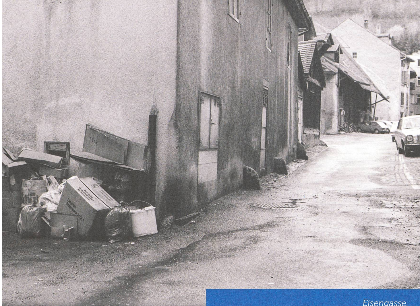
Eisengasse, Richtung Osten