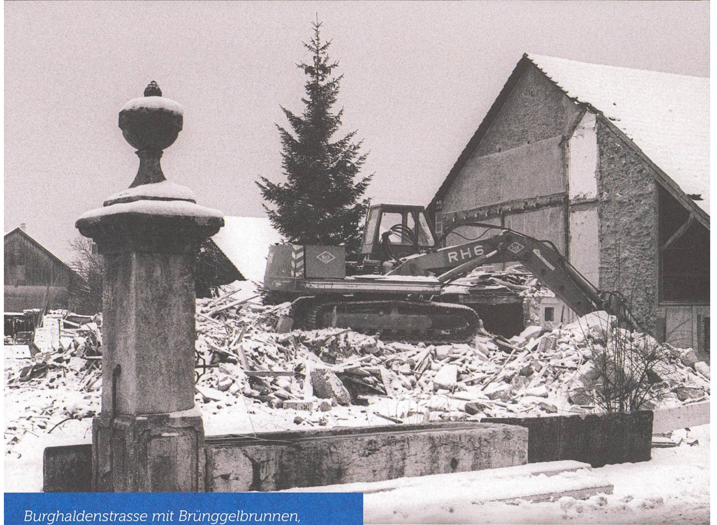
Burghaldenstrasse mit Brüggelbrunnen, Richtung Südwesten