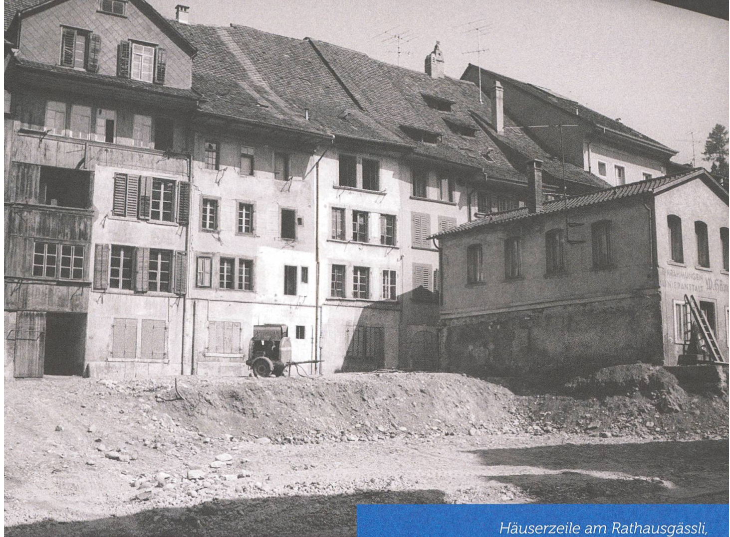
Häuserzeile am Rathausgässli, Richtung Osten