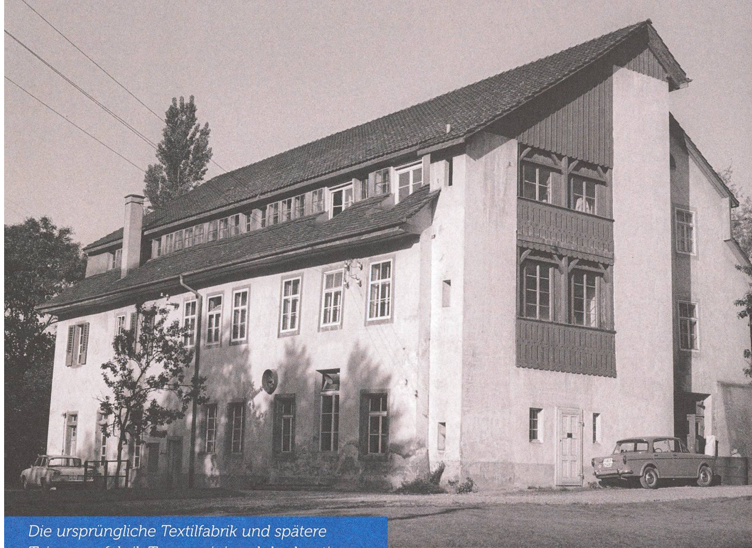
Die ursprüngliche Textilfabrik und spätere Teigwarenfabrik Tommasini und das heutige Jugendzentrum