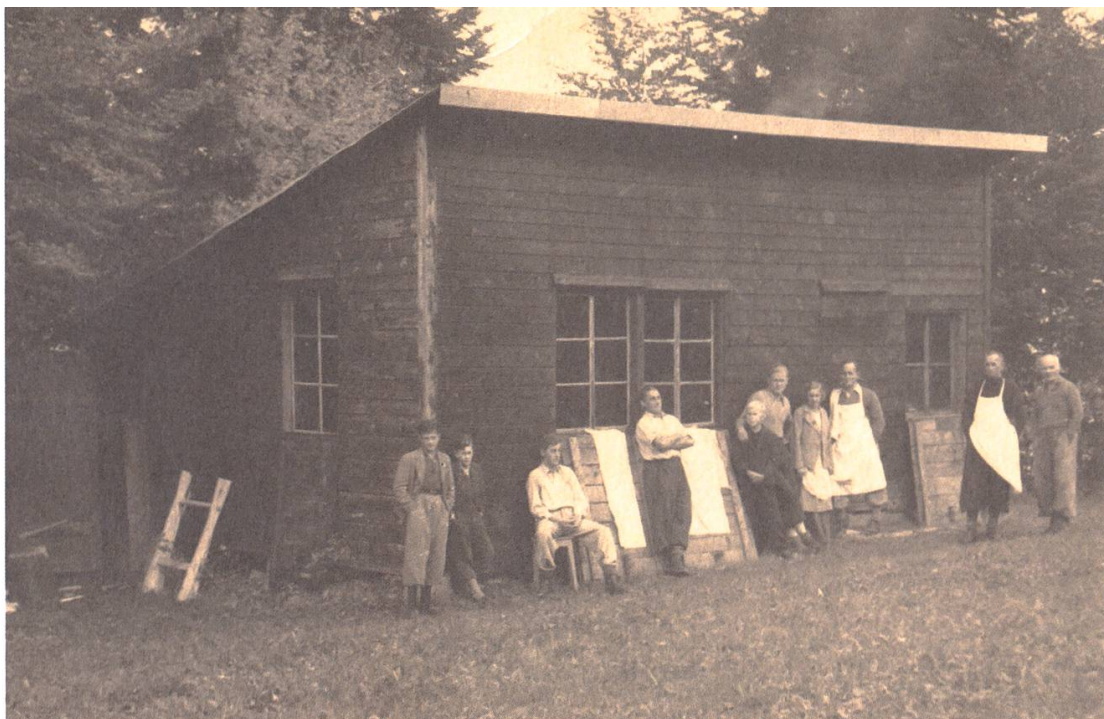
Die alte Teehütte im Jahr 1950

bei den Lenzburger Naturfreunden finden sich keine Eintragungen im Protokollbuch.