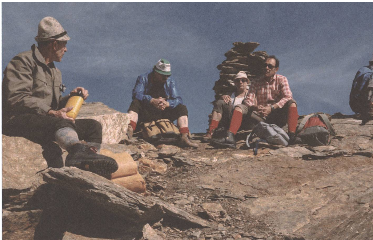
Verdiente Rast auf dem Gipfel 1992

Offiziell eingeweiht wurde die Teehütte auf dem Tellmätteli am 13./14. Februar 1937. Nach Erstellen der Schlussabrechnung zeigte sich, dass die effektiven Kosten höher als vorgesehen ausfielen, nämlich 1'200 Franken. Die Mitglieder, die jeweils Sonntagsdienst besorgten, wurden dazu verpflichtet, den Raum jeweils einer gründlichen Reinigung zu unterziehen, sowie genügend Verpflegungsmaterial zu besorgen. Nebst Suppe, Tee, Wurst und Brot wurde auch das Getränk Orangenpunch ins Sortiment aufgenommen, damals eine aufregende Neuheit. Zum Heizen und Kochen wurde Holz verwendet, und für die Beleuchtung waren Petrollampen vorhanden. Die Latrine befand sich etwas unterhalb der Hütte im Wald. Das Wasser zum Kochen musste mit der Milchbrente beim Brunnen etwa 300 Meter entfernt gezapft und hinuntergetragen werden. Geöffnet war die Teehütte, die eher wie eine Baubaracke aussah, anfänglich nur im Winter für die Skifahrer, die sich an den Wochenenden ein Stelldichein am Nordhang der Gisliflue gaben. Ab 1948 öffnete man die Teehütte regelmässig am Sonntag während des ganzen Jahres.