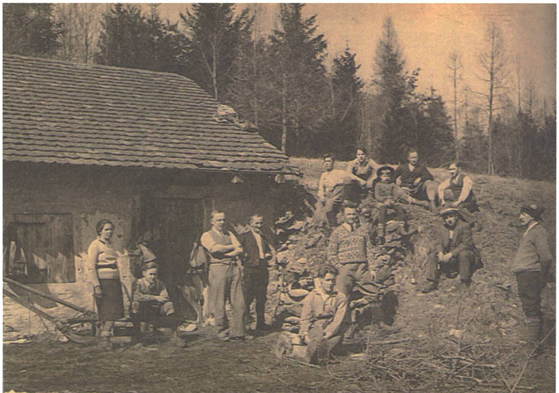
Jurawanderung 1935 zvg

Am Hang nördlich der Gisliflue wurden Skirennen durchgeführt