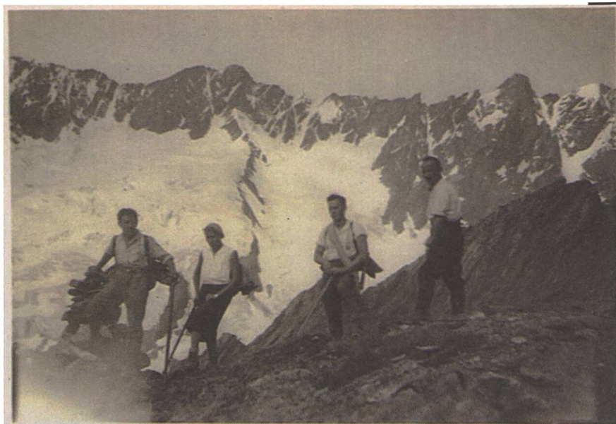
Bergtour am Sustenhorn 1932

worden. Der Landesstreik, auch als Generalstreik bekannt, im November 1918 war ein deutlicher Hinweis, dass es den Arbeitern sehr schlecht ging und sie ihre miserable Situation verbessern wollten, denn zu verlieren hatten sie nichts.