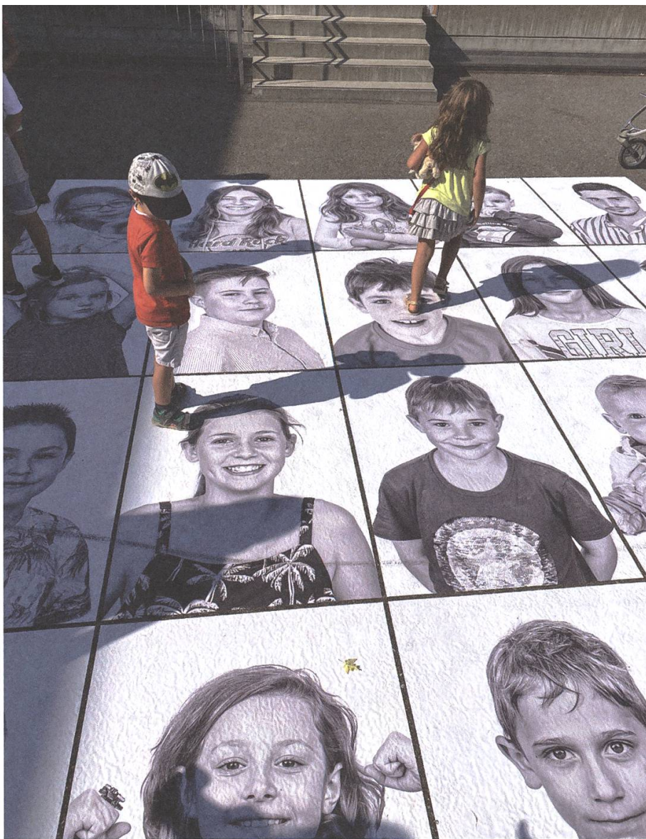
Lenzburger Kinder am Seetalplatz

Bericht in der deutschen Illustrierten «Stern» beweist. «Dahinter steckt viel freiwillige Arbeit und ich bin meinem Team unendlich dankbar dafür», sagt die Direktorin. Auch ohne Partner und grosszügige Sponsoren geht es nicht. Zum Beispiel das Stapferhaus, mit dessen Unterstützung man dieses Jahr die Hauptausstellung zum Thema «Divided we stand» gestaltete. Sie bestand aus Bildern des Schweizer Fotografen-Paars Braschler/Fischer, das 2019 mit einem Camper kreuz und quer durch die USA reiste und in eindrücklichen Bildern die Zerrissenheit der amerikanischen Bevölkerung dokumentiert.