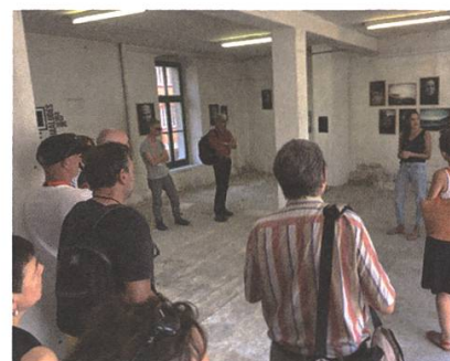
Ausstellung der Wettbewerbsprojekte in der Bleiche