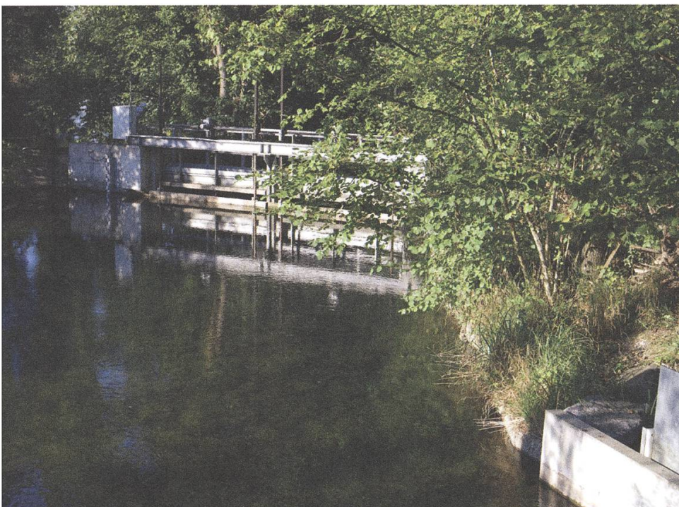
Der Aabach wurde früher intensiv genutzt HB

Im Jahr 2019 untersuchte der Kanton den Aabach letztmals detailliert in Niederlenz, südlich des Siedlungsgebietes. Das Fazit der kantonalen Erhebung lautet: