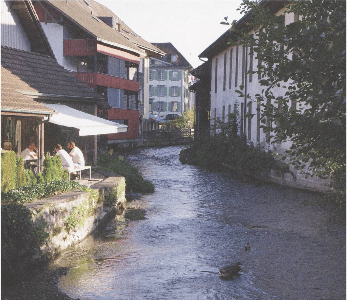
Lebensader mitten durch Lenzburg HB