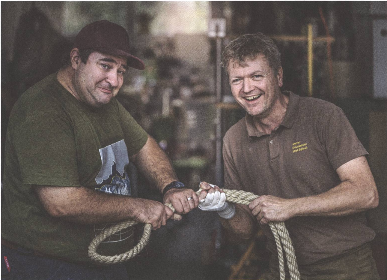
Das Werk ist vollbracht