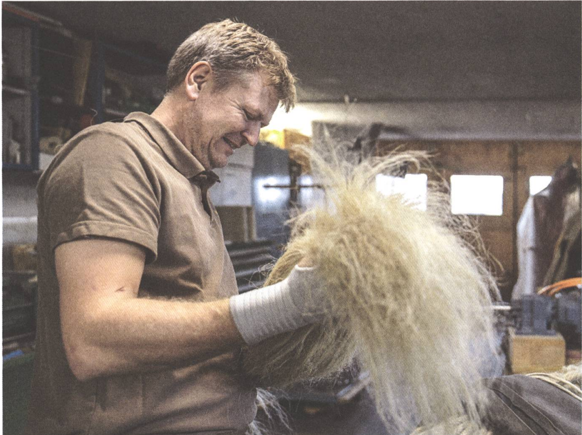
Die schön präparierten Flachszipfe