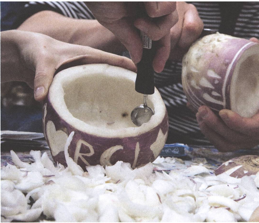
Beim Räbeliechtli-Schnitzen ist die Mithilfe der Erwachsenen gefragt

Die Tradition der Umzüge reicht nachweislich bis in die Mitte des 19. Jahrhunderts zurück. So ist etwa in der zürcherischen Gemeinde Richterswil überliefert, dass die ersten Umzüge um 1860 stattgefunden hätten. Vorher seien die Räbenlichter von einzelnen Personen verwendet worden, um im Dunkeln den Weg in den Abendgottesdienst zu finden.