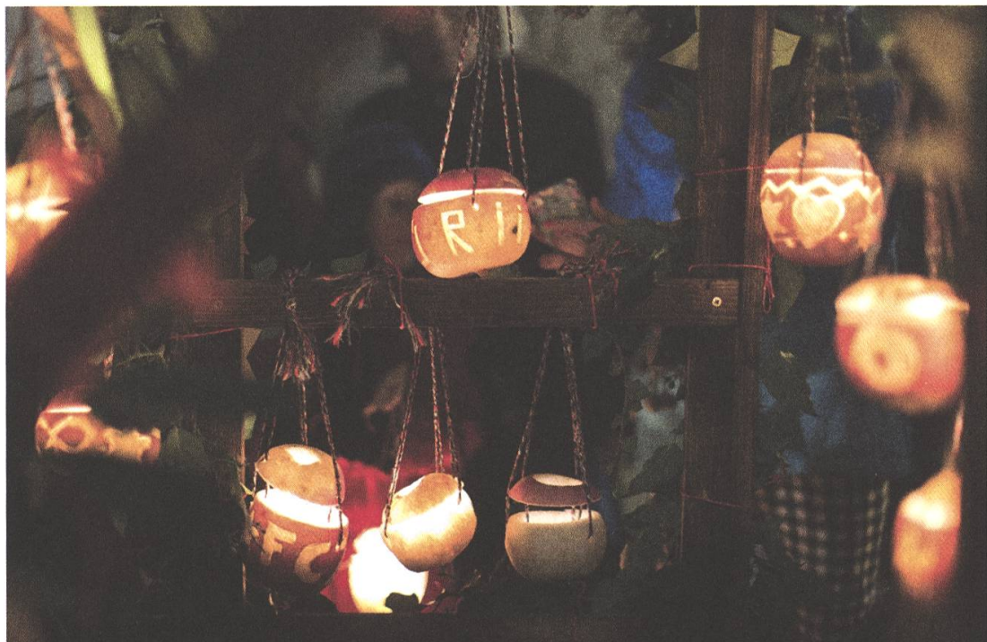
Herbstlicher Lichterglanz in der Altstadt key

Rüben oder «Räben» nahmen im Mittelalter die gleiche Stellung als Grundnahrungsmittel ein wie heute die Kartoffeln. Nach dem Einbringen der letzten Feldfrüchte im November stellten die Kinder ihre Laternen her. Heute hat die Rabe ihre Bedeutung als Grundnahrungsmittel verloren und die Bauern produzieren sie oft nur noch wegen dem «Räbeliechtliumzug».