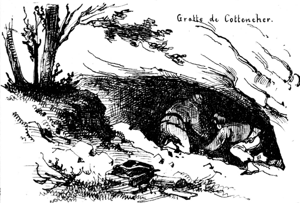
Grotte de Cottencher.