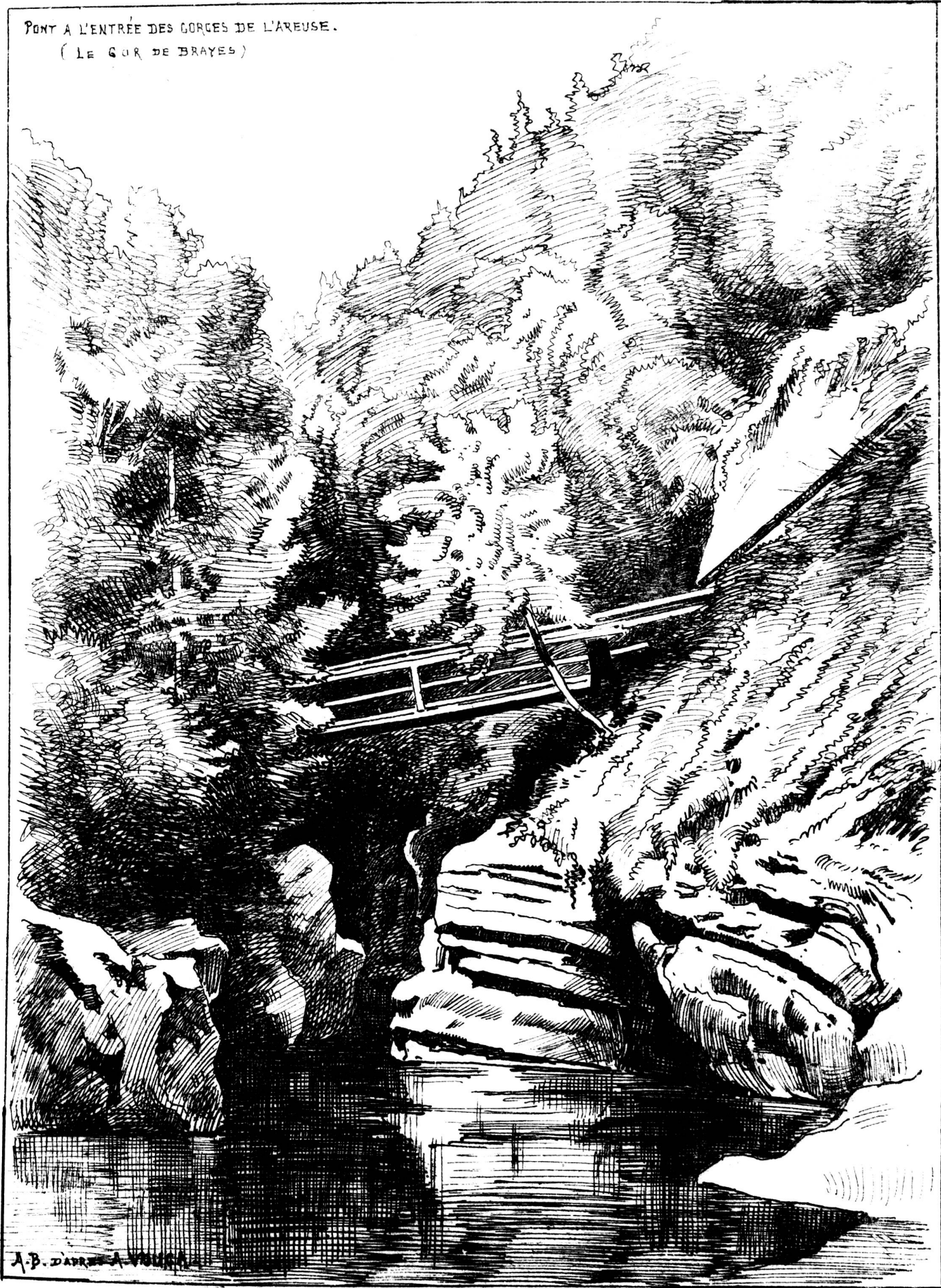
PONT A L'ENTRÉE DES GORGES DE L'AREUSE. (LE GOR DE BRAYES)