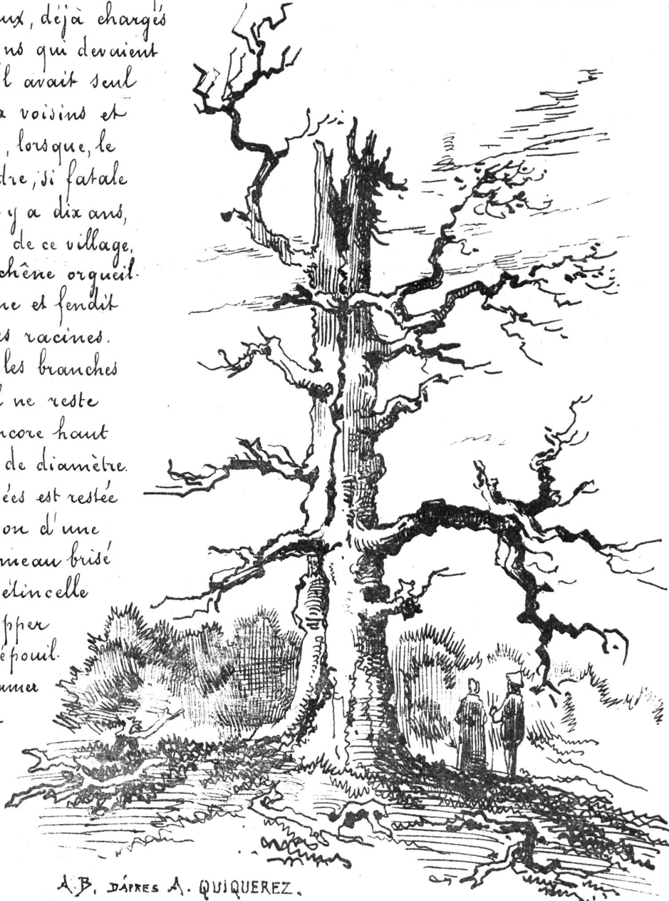
A. B. D'APRES A. QUIQUEREZ.

Sur la rive gauche du torrent de la Rouge-eau, à un kilomètre du village de Bassecourt, un chêne élevait fièrement sa tête à plus de seize mètres au-dessus des saules qui bordaient le ruisseau. Il était au loin ses rameaux vigoureux, déjà chargés de feuilles et de chatons qui devaient produire des glands. Il avait seul survécu à de nombreux voisins et bravé bien des tempêtes, lorsque, le 26 mai dernier, la foudre, si fatale à cette contrée et qui, il y a dix ans, avait détruit la moitié de ce village, frappa à son tour le chêne orgueilleux. Elle brisa sa cime et fendit sa souche jusque sur les racines. Elle dispersa au loin les branches fracassées, en sorte qu'il ne reste qu'un tronc noueux, encore haut de onze mètres sur un de diamètre. Une des branches cassées est restée suspendue sur le tronçon d'une autre et un grand rameau brisé pend jusqu'à terre. L'étincelle électrique a dû envelopper l'arbre entier pour le dépouiller de feuilles et le déramer de la sorte; et cependant elle a tracé un sillon vertical du haut en bas du tronc, arrachant l'écorce épaisse sur son passage et,