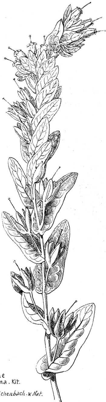
Cerinthé alpina . Kit.