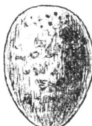
Coucou. gris brun.