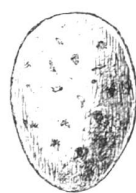
Coucou. gris brun.