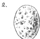
2. Pouillot. Oeufs blancs à taches nombreuses, d'un brun foncé.