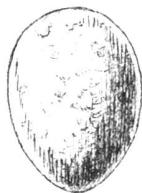
Coucou. gris brun.