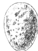
Coucou. gris verdâtre, taches brunes.

sissait, il faudrait croire que c'est pour tromper plus facilement les parents adoptifs qu'il veut octroyer à son petit, mais en tout cas la différence de taille de l'oeuf étranger ne peut échapper à ceux-ci : dans les 15 pontes dont je parle l'oeuf du coucou est, sauf une exception, plus gros que les autres, quelquefois même la différence est considérable. Tantôt l'oeuf du coucou est sensiblement de la même couleur que les autres, tantôt il est d'une couleur toute différente. On pourrait admettre, ce semble, que