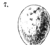
7. Fauvette des jardins. gris brun.

le coucou cherche réellement un nid où les oeufs ressemblent au sien, mais que s'il ne le trouve pas, il prend le premier nid venu. Cependant, je doute, parce que, comme je l'ai dit, il me semble impossible que les parents qui couvent un oeuf de coucou ne s'en rendent pas compte. Examinons les oeufs de la collection Robert et voyons ce qu'ils nous révèlent à ce sujet.