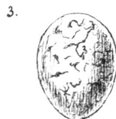
3. Bruant jaune. Oeufs d'un grisâtre violacé pâle à fines lignes brunes bizarrenment contournées.