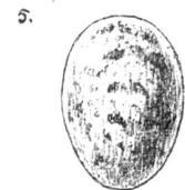
5. Rouge-gorge. Oeufs rougeâtres à taches d'un brun rouge.