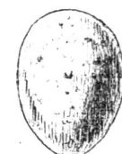
Coucou. gris brun.