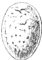
Coucou. blanc, taches brunes.