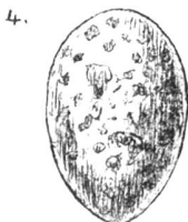
4. Rousserolle turdoïde, verdâtres pâles, à taches brunes.

sissait, il faudrait croire que c'est pour tromper plus facilement les parents adoptifs qu'il veut octroyer à son petit, mais en tout cas la différence de taille de l'oeuf étranger ne peut échapper à ceux-ci : dans les 15 pontes dont je parle l'oeuf du coucou est, sauf une exception, plus gros que les autres, quelquefois même la différence est considérable. Tantôt l'oeuf du coucou est sensiblement de la même couleur que les autres, tantôt il est d'une couleur toute différente. On pourrait admettre, ce semble, que