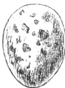
Coucou. gris brun.