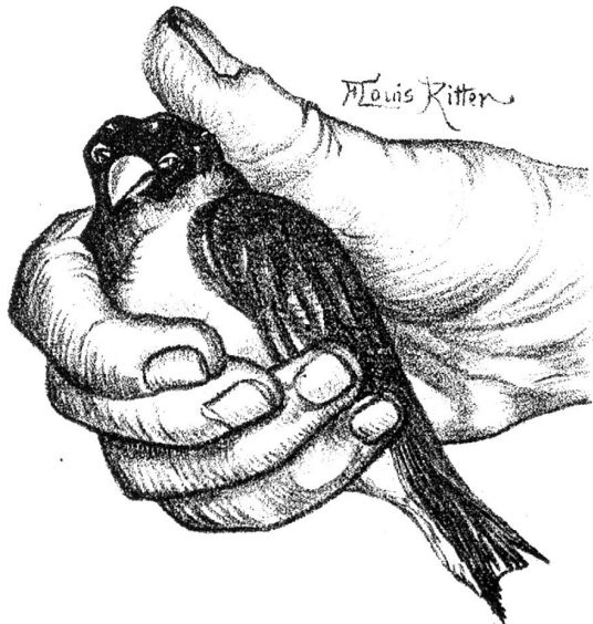
Bouvreuil après l'accident.