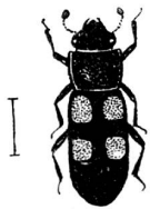
Ips quadripustulatus, L.

La trouvaille faite dernièrement à Soullierel d'un petit coléoptère, que je crois très rare dans la contrée, m'engage à en faire part aux lecteurs du « Rameau de Sapin » qui s'intéressent à l'entomologie. Mon désir serait de savoir si vraiment cet insecte est rare dans notre pays et dans quelles régions éventuellement il a été capturé. Pour ma part, depuis environ quarante ans que je chasse plus ou moins, je ne l'avais jusqu'à maintenant pas rencontré.