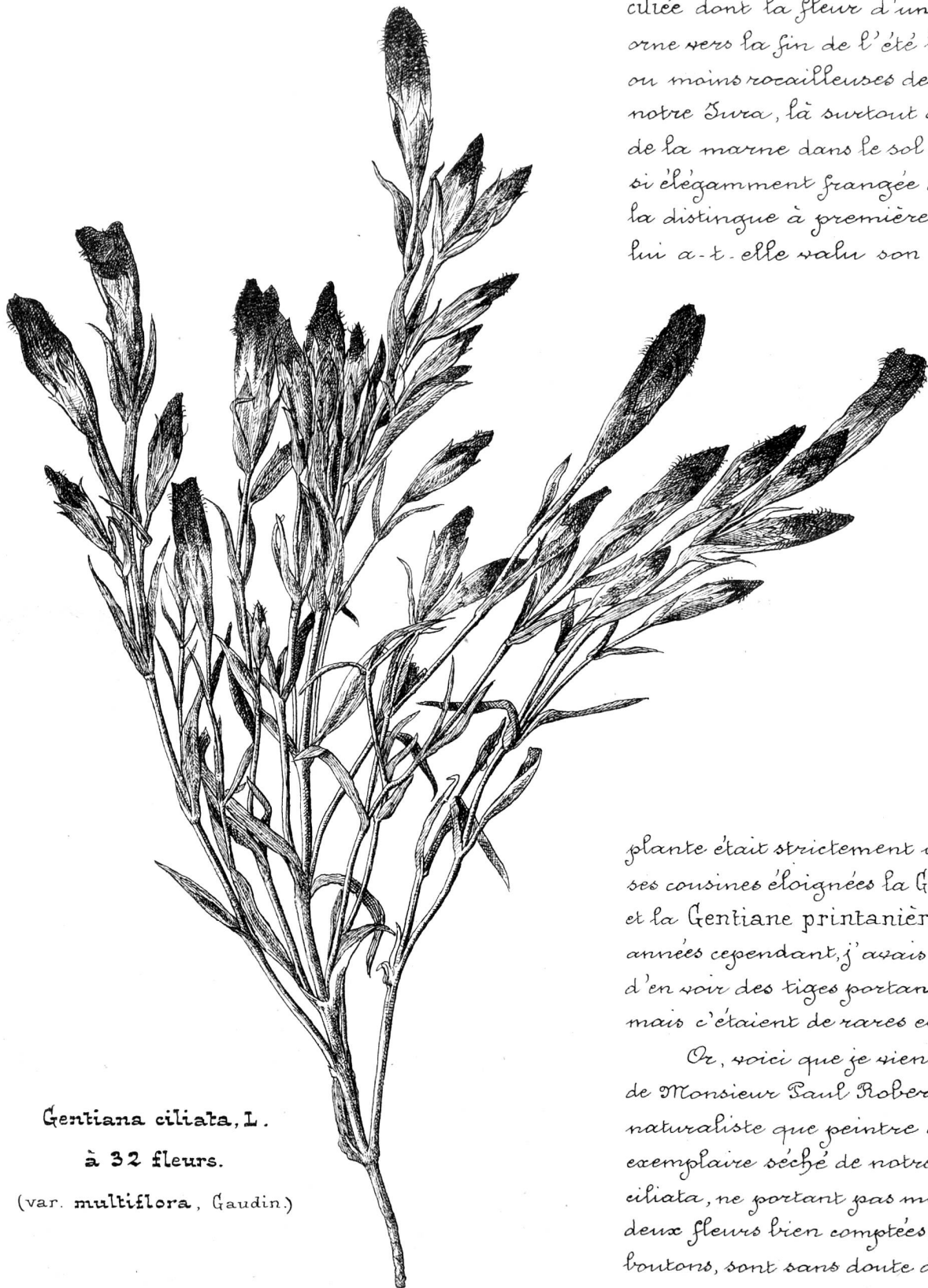
Gentiana ciliata , L.