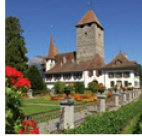
Schloss Spiez Geschichte und Kunst

Das Schloss Hünegg in Hilterfingen wurde 1861 nach Vorbildern der französischen Loire-Schlösser erbaut. Sein Jugendstil-Interieur ist seit 1900 unverändert geblieben. Sonderausstellung 2016: «Delightful Horror» – Die Erhabenheit der Alpen und der frühe Fremdenverkehr.