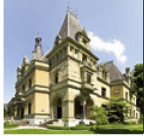
Schloss Hünegg Das märchenhafte Schloss am Thunersee

Das Schloss Hünegg in Hilterfingen wurde 1861 nach Vorbildern der französischen Loire-Schlösser erbaut. Sein Jugendstil-Interieur ist seit 1900 unverändert geblieben. Sonderausstellung 2016: «Delightful Horror» – Die Erhabenheit der Alpen und der frühe Fremdenverkehr.