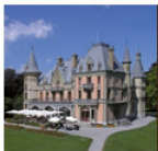
Schloss Schadau Die Perle am Thunersee

Schloss Thun bietet einen unvergleichlichen Blick auf See, Stadt und Berge. Die neu gestalteten Ausstellungen in den verschiedenen Stockwerken des 800jährigen Donjons lassen die Vergangenheit der Gegend auferstehen. Sonderausstellung 2016: «Spuren der Vergangenheit – eine Zeitreise im Schloss Thun».