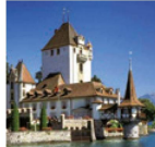
Schloss Oberhofen Magie aus acht Jahr- hunderten

Die unvergleichliche Lage am Wasser, eine atemberaubende Aussicht. Beste Küche und herzlicher Service vom Frühstück bis zum Abendessen. Die Geschichte der Gastronomie dargestellt im Gastronomiemuseum.