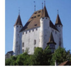
Schloss Thun Das Museumsschloss

Schloss Spiez und die romanische Schlosskirche liegen auf einer kleinen Halbinsel, umgeben von Thunersee und Bergen. Die neue Dauerausstellung gibt Einblick in die 1300jährige Geschichte. Sonderausstellung 2016: «Ernst Ludwig Kirchner: Dresden – Berlin – Davos».