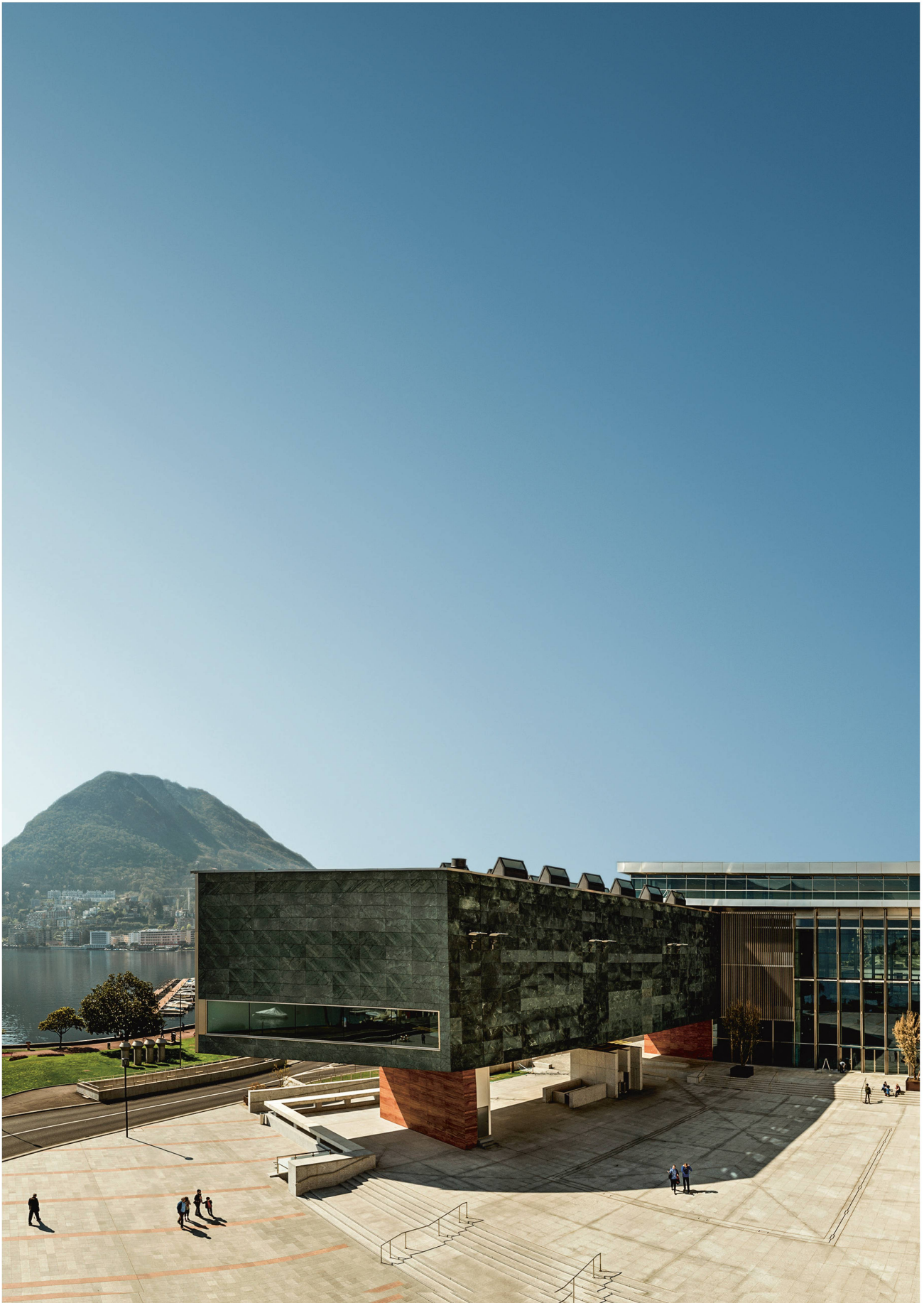
Das LAC verleiht Lugano internationales Flair.