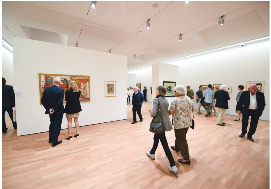
Das Museum zieht auch viele Gäste an, die nicht im Kanton Tessin wohnen.

einbringen wird. Im April stehen die Werke zweier bedeutender italienischer Künstler der Nachkriegszeit, Alighiero Boetti und Salvo, im