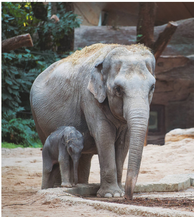
Im Februar haben die Dickhäuter im Zoo Zürich Zuwachs gekriegt: Das Elefantenmädchen Ruwani entzückt kleine wie grosse Besucher. www.zoo.ch