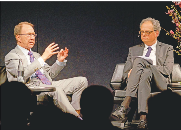
Im März gastierte Sir Ian Kershaw (links) im Landesmuseum. Der Brite gehört zu den weltweit renommiertesten Historikern.