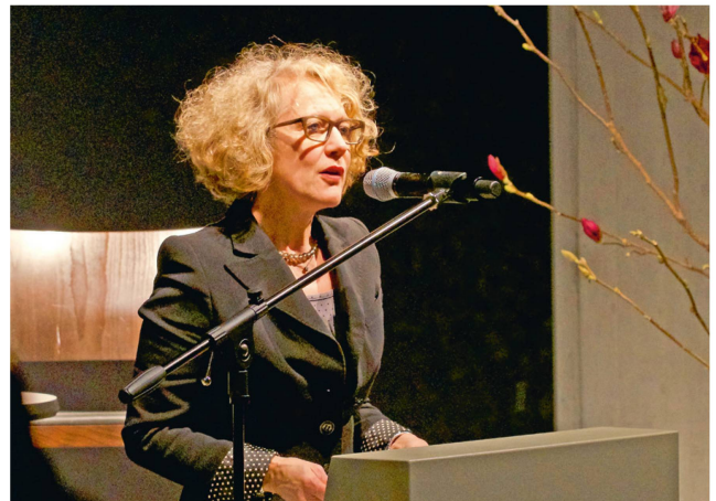
Corine Mauch wünscht sich eine Stadt, die sich international als Kunst- und Kulturdestination etablieren kann. Das sagte die Zürcher Stadtpräsidentin an einer Diskussion im Landesmuseum.