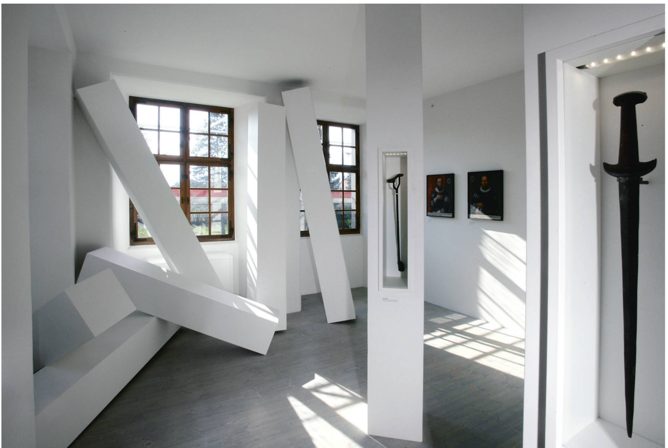
Das Museum Bruder Klaus Sachseln verfolgt den Einfluss von Niklaus von Flüe durch die Jahrhunderte.