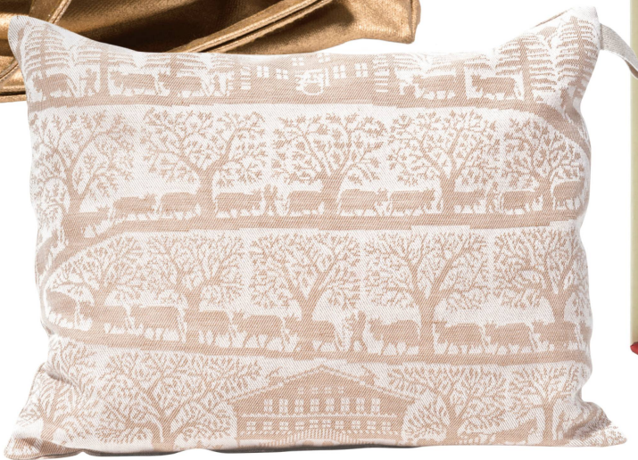
Arvenholz-Sacht: Alpaufzug Hülle Halbleinen Jacquard / CHF 76