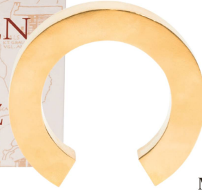
Armreif: Big Hollow Bracelet Felix Doll, Messing, 24 ct vergoldet / CHF 699