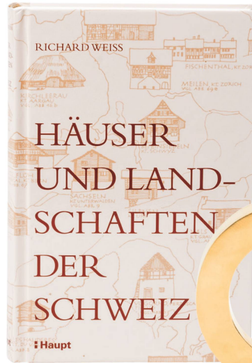
Buch: Häuser und Landschaften der Schweiz Richard Weiss, Haupt Verlag, 2017 / CHF 38