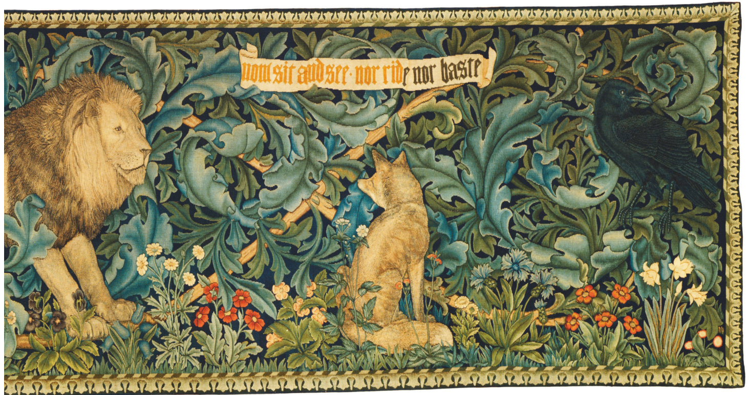
William Morris interessierte sich für die Wiederbelebung mittelalterlicher Handwerkstechniken, zu denen die Fertigung hochwertiger Wandteppiche gehörte. Er liess diese in seiner Manufaktur in traditioneller Art und Weise herstellen.

ausdrückt. Den erhielt die Schweiz an der Weltausstellung 1873. In Wien wurden die Schweizer Erzeugnisse zwar ihrer Brauchbarkeit wegen gelobt, nicht jedoch ihrer formalen Qualität und ästhetischen Originalität wegen: «Man ist bemüht, nicht zurückzubleiben, man strebt andererseits nicht danach, eine der Lage nicht angemessene Höhe zu erklimmen», ist im amtlichen Bericht der Wiener Weltausstellung über die Schweizer Produkte zu lesen. Das traf die Unternehmer ins Mark: Die Société des patrons graveurs gründete in La Chaux-de-Fonds die