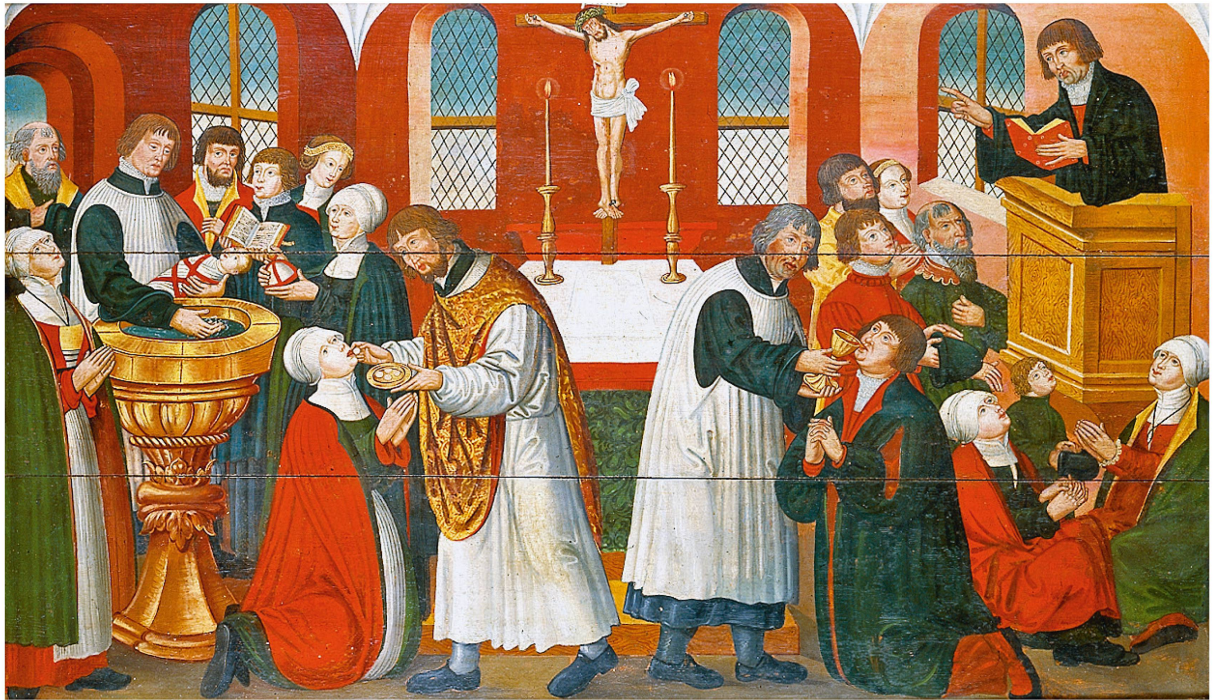
Altarbild aus der Pfarrkirche Torslunde, 1561. Unbekannter Maler. Dänisches Nationalmuseum.

Jesus Christus während des Abendmahls leiblich anwesend sei. Für Zwingli war das Abendmahl eine symbolische Handlung, eine Erinnerungsfeier. Für Luther waren Brot und Wein, die während der Feier ausgeteilt werden, der wahre Leib und das wahre Blut Christi.