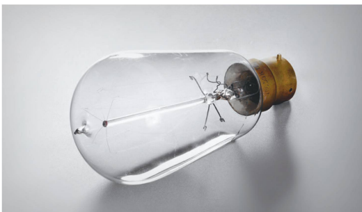
Mit der Glühlampe wird das elektrische Licht in die Städte gebracht und die Elektrifizierung vorangetrieben. Das elektrische Licht setzt sich Ende des 19. Jahrhunderts gegen das Gaslicht durch.

erste Kunstgewerbeschule. Ihr folgte die Ostschweizer Textilindustrie mit einer Schule in St. Gallen, danach zogen Genf (1876), Luzern (1877) und Zürich (1878) nach. Was die Weltausstellungen in Paris, London, New York, Wien, Philadelphia oder Barcelona präsentierten, fand den Weg in die modernen und mehrstöckigen Wohnhäuser des städtischen Bürgertums. Diese Erkenntnis war der Startschuss für die vielen Schweizer Manufakturen und Fabriken, die in Kürze auch eine internationale Kundschaft zu pflegen begannen. ♻