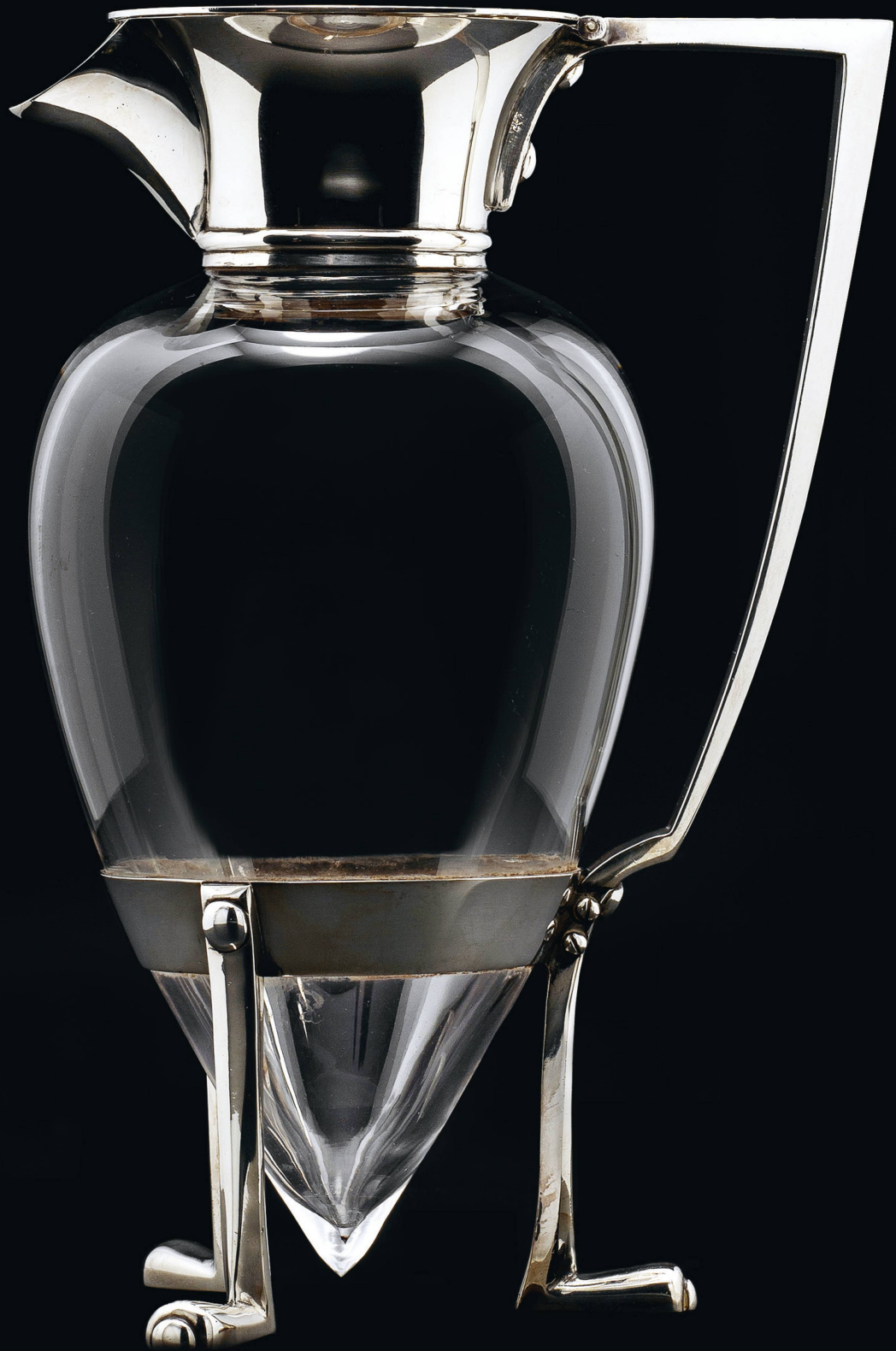
Die Form der Weinkaraffe erinnert an eine griechische Amphore mit ihrer typischen Halterung und der spitzen Basis. Dresser transformierte das antike Vorbild in ein optisch leichtes und elegantes Gefäß.