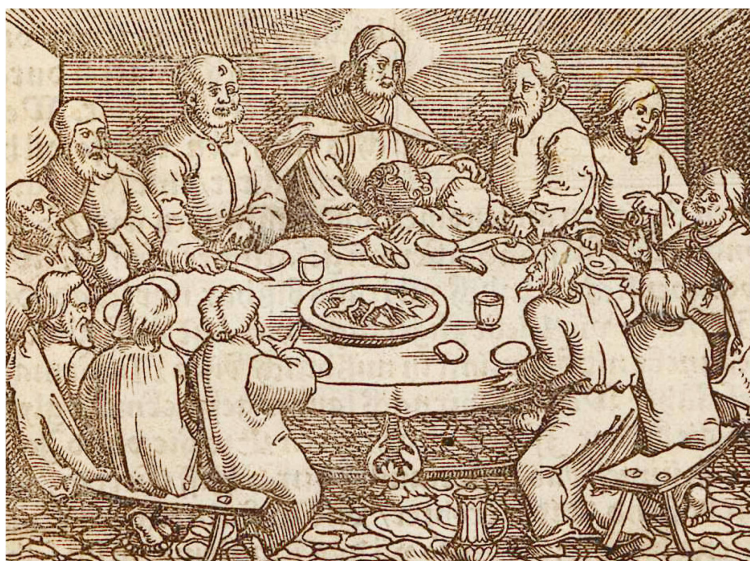
Holzchnitt aus Zwinglis Abendmahlschrift.

Von den sieben Sakramenten der alten Kirche sind in der heiligen Schrift nur die Taufe und das Abendmahl ein Thema. Die Reformatoren schafften daher die anderen fünf ab. In diesem Punkt waren sich Martin Luther und Ulrich Zwingli einig. In anderen Fragen entfachte sich bald ein Konflikt zwischen den beiden und ihren jeweiligen Anhängern. Grösster Streitpunkt war die Bedeutung des Abendmahls. Für Menschen des 21. Jahrhunderts kaum nachzuvollziehen, stritten sich die Reformatoren um die Frage, ob