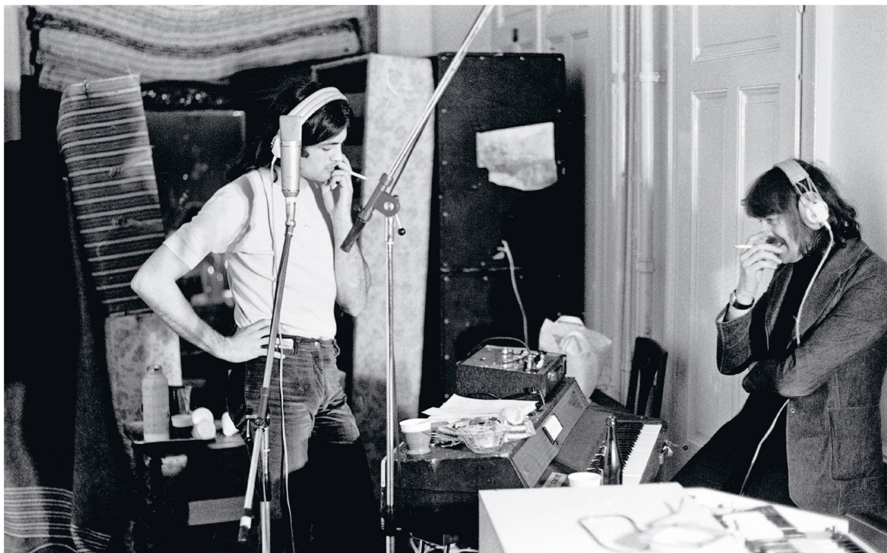
Ian Gillan und Jon Lord von der Band Deep Purple waren 1971 in Montreux für Studioaufnahmen. Dabei erlebten sie den Brand beim Frank-Zappa-Konzert mit.

hatte mit Claude Nobs zu tun. Der exzentrische Festivalleiter hatte den Event 1967 gemeinsam mit zwei weiteren Personen gegründet. Damals war Nobs noch stellvertretender Direktor beim Fremdenverkehrsbüro von Montreux und wollte die Region rund um das Städtchen am Genfersee beleben. Das Jazzfestival entwickelte sich jedoch schnell zu mehr als einem touristischen Magnet und Nobs kümmerte sich immer intensiver um die musikalischen Leitplanken. Und genau dies tat er perfekt. Die weltbekannten Musiker fühlten sich in Montreux pudelwohl und kamen in Scharen. Und Funky Claude wusste immer ganz genau, was die Stars brauchten. Der eine wollte einen gelben Ferrari am Flughafen, der andere eine Tour auf einem Fischerboot. Claude Nobs machte es möglich und erfüllte den immer klingenderen Namen jeden Wunsch.