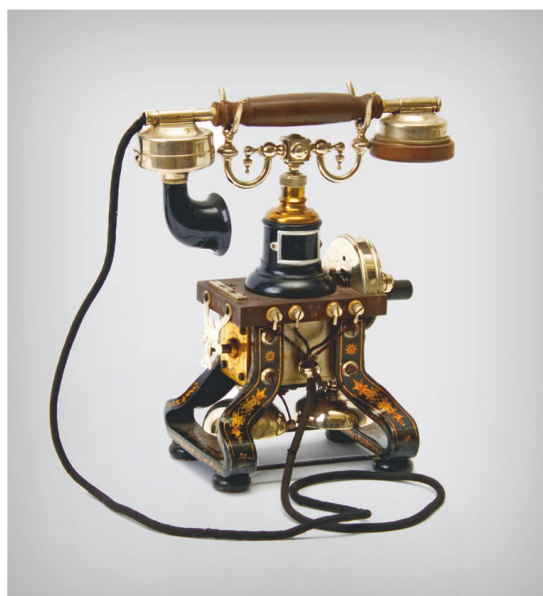
Dieses Tischtelefon von Ericsson stammt aus dem Jahr 1892 und wurde mit Wechselstrom betrieben.

Alltägliche Dinge sollten nicht nur praktisch sein, sondern auch schön. Während dies andernorts erkannt worden war, brauchte die Schweiz einen Weckruf, oder vielmehr einen Schubser, wie der Nobelpreisträger Richard Thaler sich