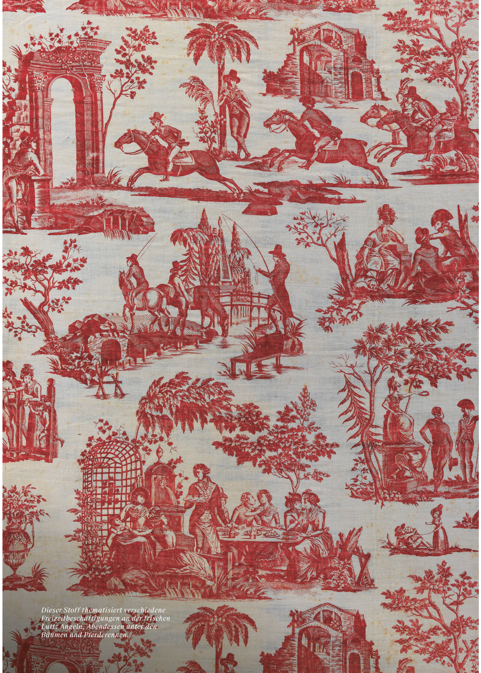
Dieser Stoff thematisiert verschiedene Freizeitbeschäftigungen an der frischen Luft: Angeln, Abendessen unter den Bäumen und Pferderennen.