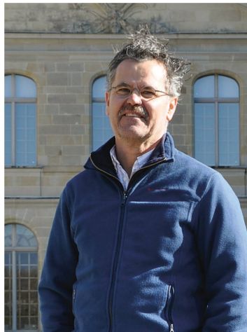
Der Künstler Muma lebt seit 1986 in Lausanne.

Die Indiennes-Mode kam in einer spannungsgeladenen Welt auf, in der die bedeutenden religiösen Strömungen das Tragen schwarzer Kleidung empfahlen. Die bunten Baumwollstoffe gerieten also mit diesem Zurückhaltungsdenken in Konflikt. Für mich, der sich gewöhnlich in einer Welt aus Hell-Dunkel und grossen Pixeln (den Kerzen) bewegt, ist der Übergang von Farbschattierungen zur absoluten Farbigekeit ebenfalls eine beträchtliche Herausforderung. Mit meiner Erfahrung und der intensiven Auseinander-