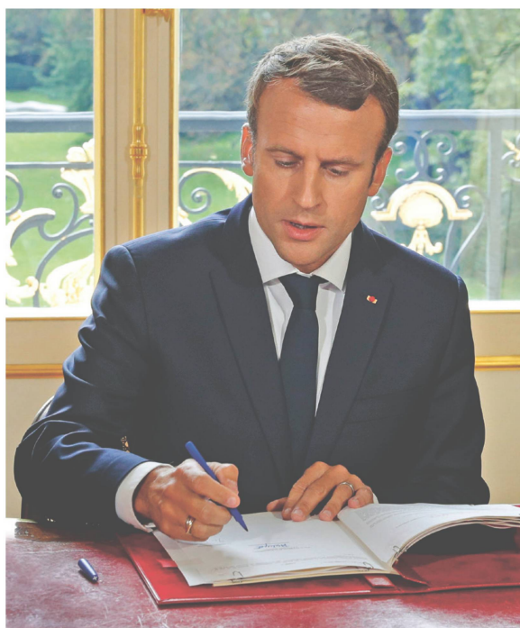
Der französische Staatspräsident Emmanuel Macron lobt in einem Brief die Ausstellung im Château de Prangins.

22. APRIL – 14. OKT 18 CHÂTEAU DE PRANGINS Indiennes: Bedruckte Baumwollstoffe erobern die Welt