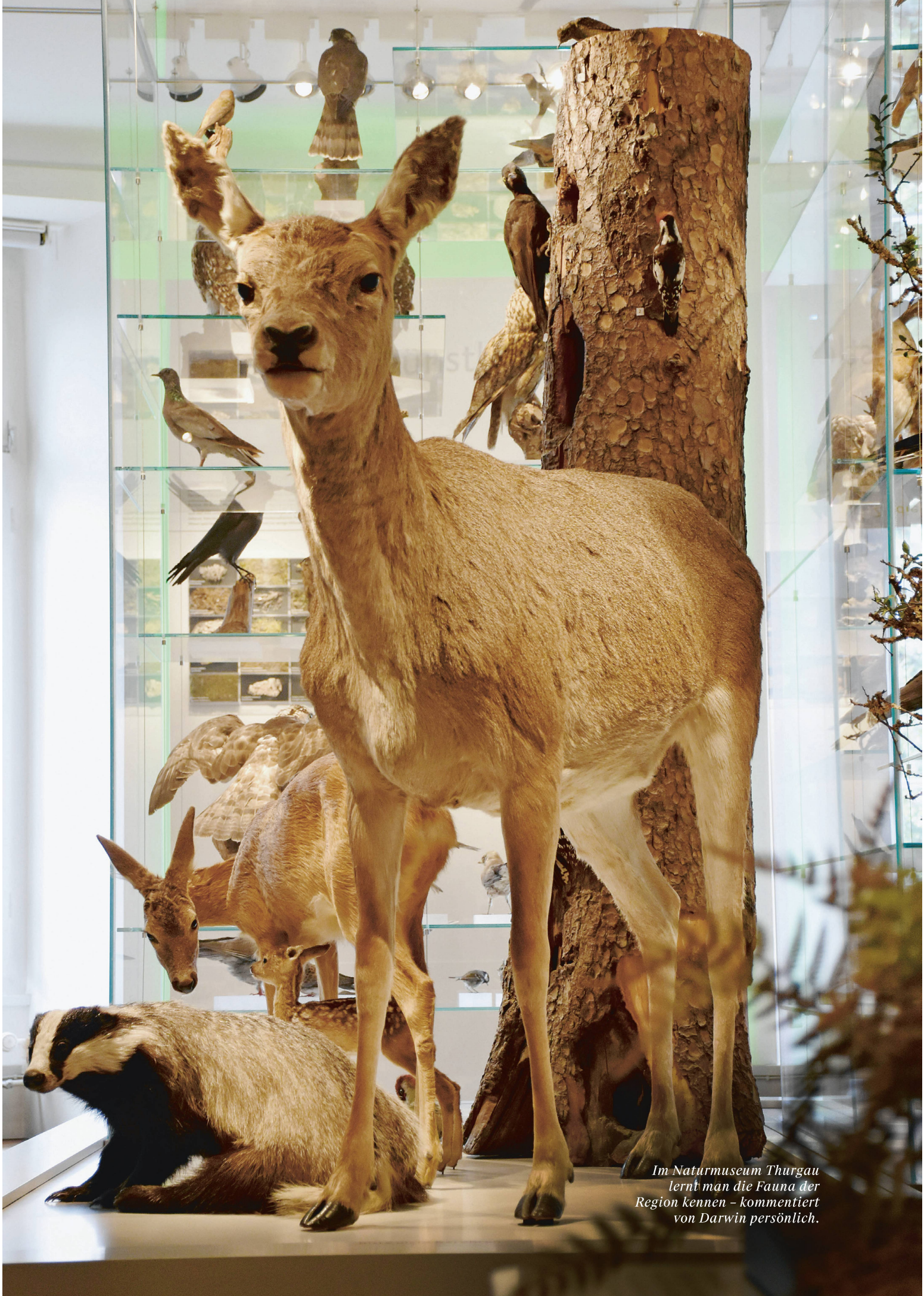
Im Naturmuseum Thurgau lernt man die Fauna der Region kennen – kommentiert von Darwin persönlich.