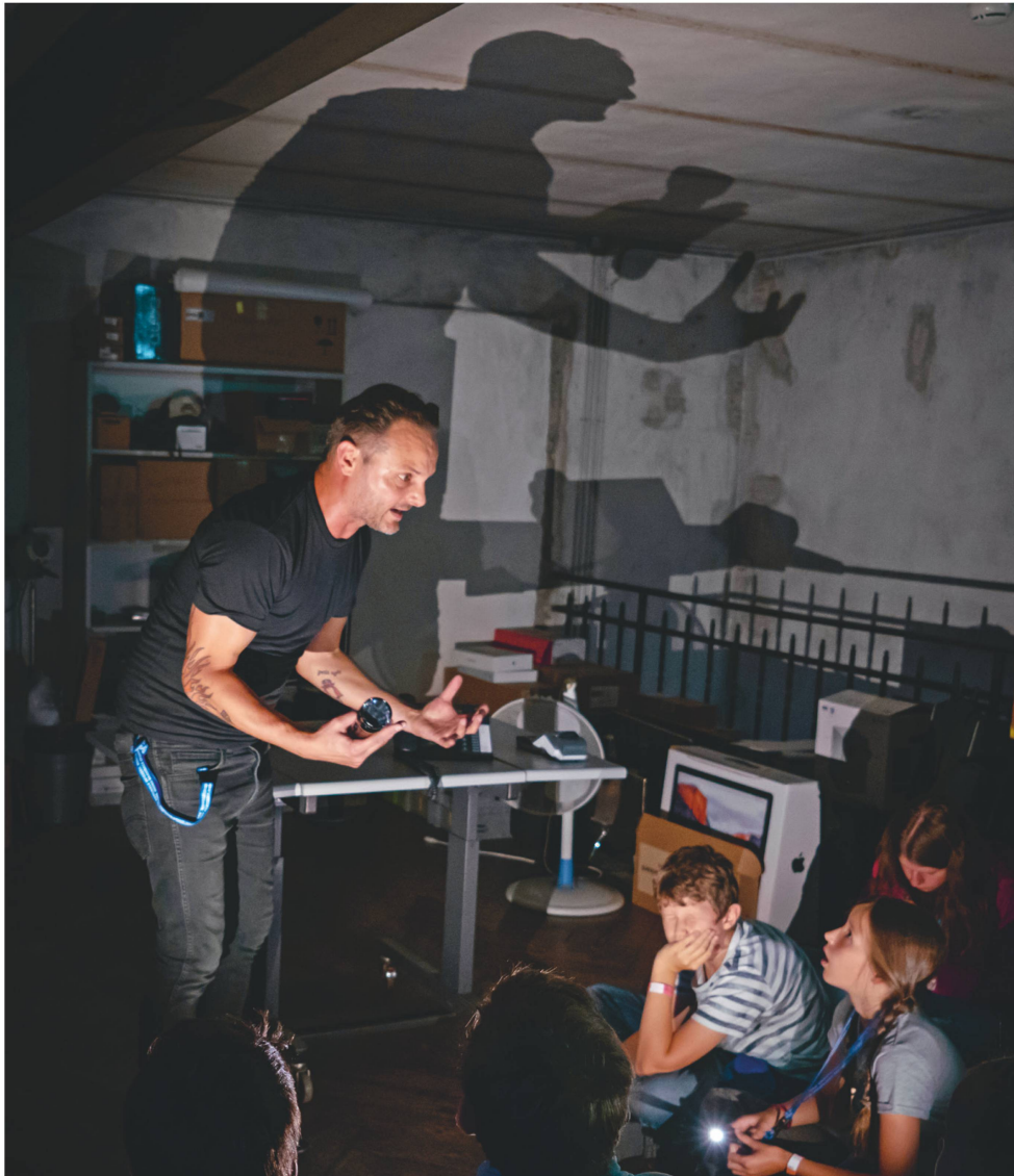
An der Langen Nacht der Zürcher Museen im September inszenierte TV-Moderator Dominic Deville das Kult-Jugendbuch «Die drei ???».