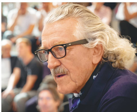
Dieter Meier, Yello-Sänger, zog es an die Vernissage der Ausstellung «Imagine 68. Das Spektakel der Revolution» im Landesmuseum Zürich.

Bruder Gerold Zenoni kümmert sich normalerweise um die Garderobe der Schwarzen Madonna im Kloster Einsiedeln. Die Eröffnung der Ausstellung «Heilige – Retter in der Not» im Forum Schweizer Geschichte Schwyz genoss er als Gast.