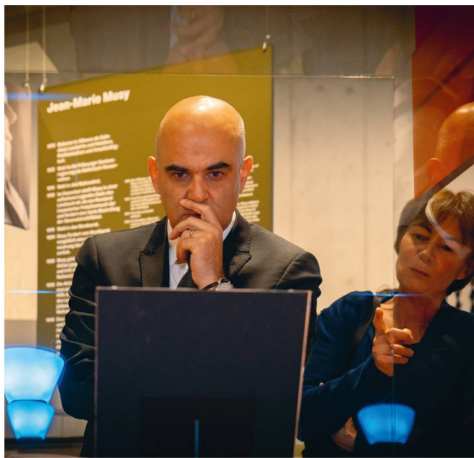
Bundesrat Alain Berset eröffnete im November die Ausstellung «Landesstreik 1918» im Landesmuseum Zürich.

Persönlichkeiten, die in jüngster Zeit das Schweizerische Nationalmuseum besucht haben.