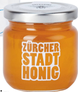
Honig: Zürcher Stadthonig 250 g / CHF 17