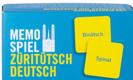
Memospiel: Züritütsch Fidea Design / CHF 33