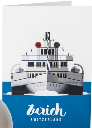
Karte: Zürich Schiff Doppelkarte, diverse Sujets/ CHF 6.90