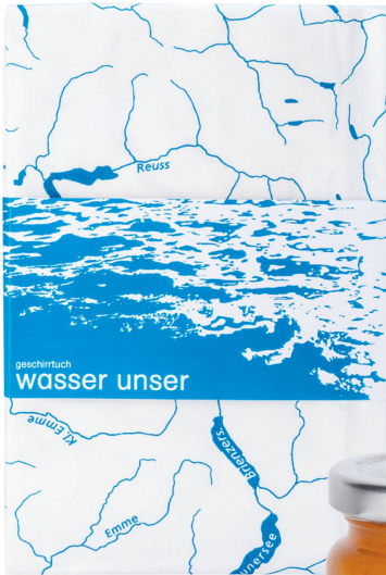
Küchentuch: Wasser unser Alpines Museum der Schweiz / CHF 19.90