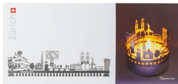
Windlicht: Zürich T-Light Schattenspiel und Windlicht mit Edelstahl-Silhouette / CHF 8