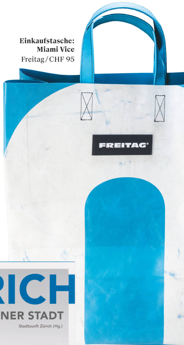
Einkaufstasche: Miami Vice Freitag / CHF 95