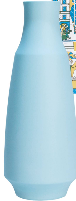
Flasche blau: Therese Müller Keramikwerkstatt Porzellan / CHF 180