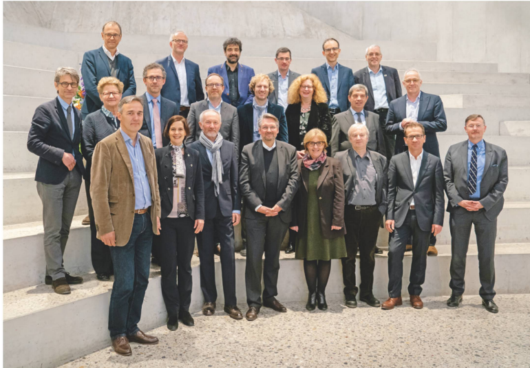
Eine geballte Ladung Geschichte: Im Frühling trafen sich die Direktorinnen und Direktoren von historischen Museen aus dem deutschsprachigen Europa in Zürich.

Persönlichkeiten, die in jüngster Zeit das Schweizerische Nationalmuseum besucht haben.