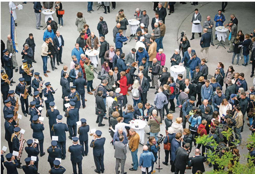
Nach der Sitzung kam es im Innenhof des Museums zur Begegnung mit der Bevölkerung.

Einmal pro Jahr tagt der Bundesrat ausserhalb des Bundeshauses. Dieses Jahr machte er im Landesmuseum Zürich Halt.