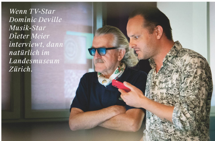
Wenn TV-Star Dominic Deville Musik-Star Dieter Meier interviewt, dann natürlich im Landesmuseum Zürich.