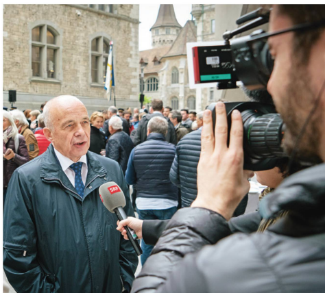
Als Zürcher stand Bundespräsident Ueli Maurer besonders im Fokus der Medien.