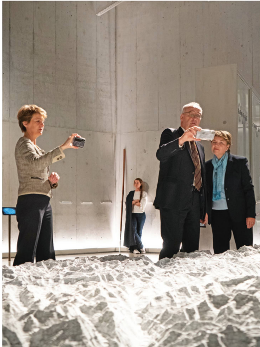
Die interaktiven Möglichkeiten zogen auch die Landesregierung in ihren (digitalen) Bann.

Privatsphäre geschützt, geteilt, verkauft