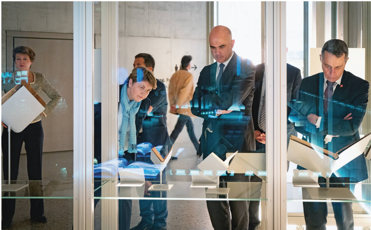
Die Dauerausstellung «Ideen Schweiz» gefiel der Landesregierung besonders gut.