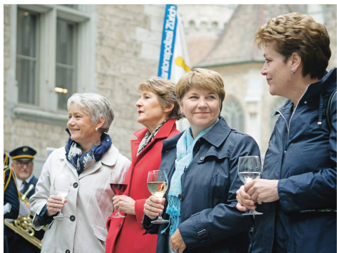
Frauenpower: Beim Besuch in Zürich zeigte der Bundesrat seine weibliche Seite. Der Bevölkerung gefiel es.