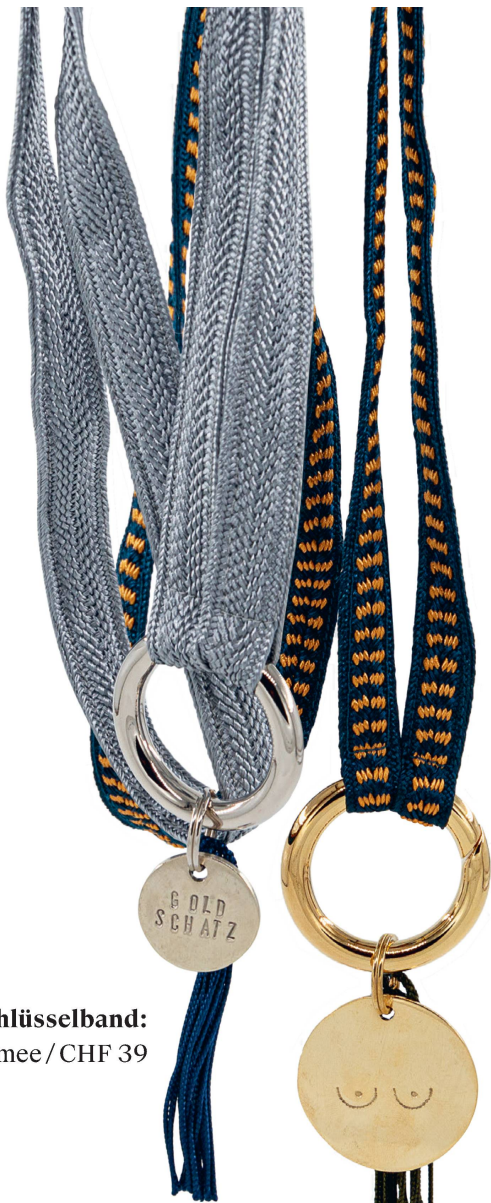
Schlüsselband: Yoomie / CHF 39