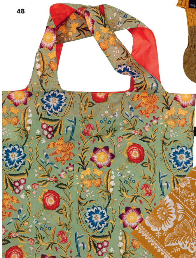
Tasche faltbar: Blumenmuster Aus der Sammlung Schweizerisches Nationalmuseum, Loqi «limited edition»/CHF 18.50