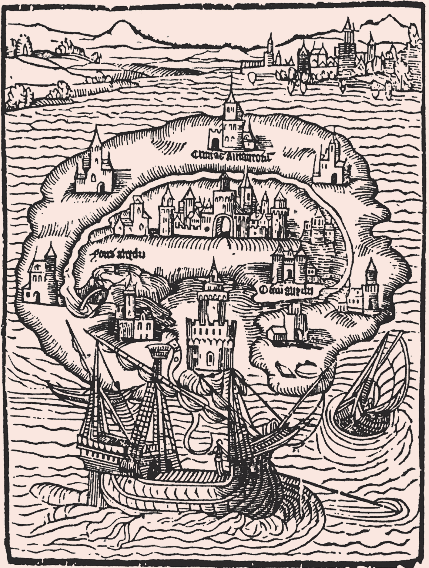
Holzchnitt aus Thomas Morus' Roman Utopia, 1516.