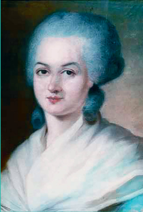
Olympe de Gouges, gemalt von Alexander Kucharsky, 18. Jahrhundert.