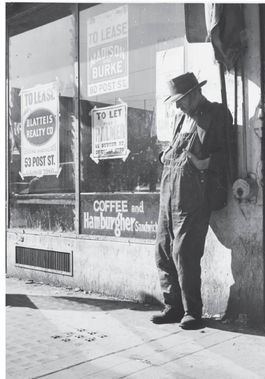
Arbeitsloser in der Great Depression, fotografiert von Dorothea Lange, ca. 1935.

europäische Gesellschaft während mehrerer Jahrhunderte. Morus selbst wurde 1535 hingerichtet, weil er Heinrich VIII., der sich von der katholischen Kirche abgewendet hatte, nicht unterstützte.