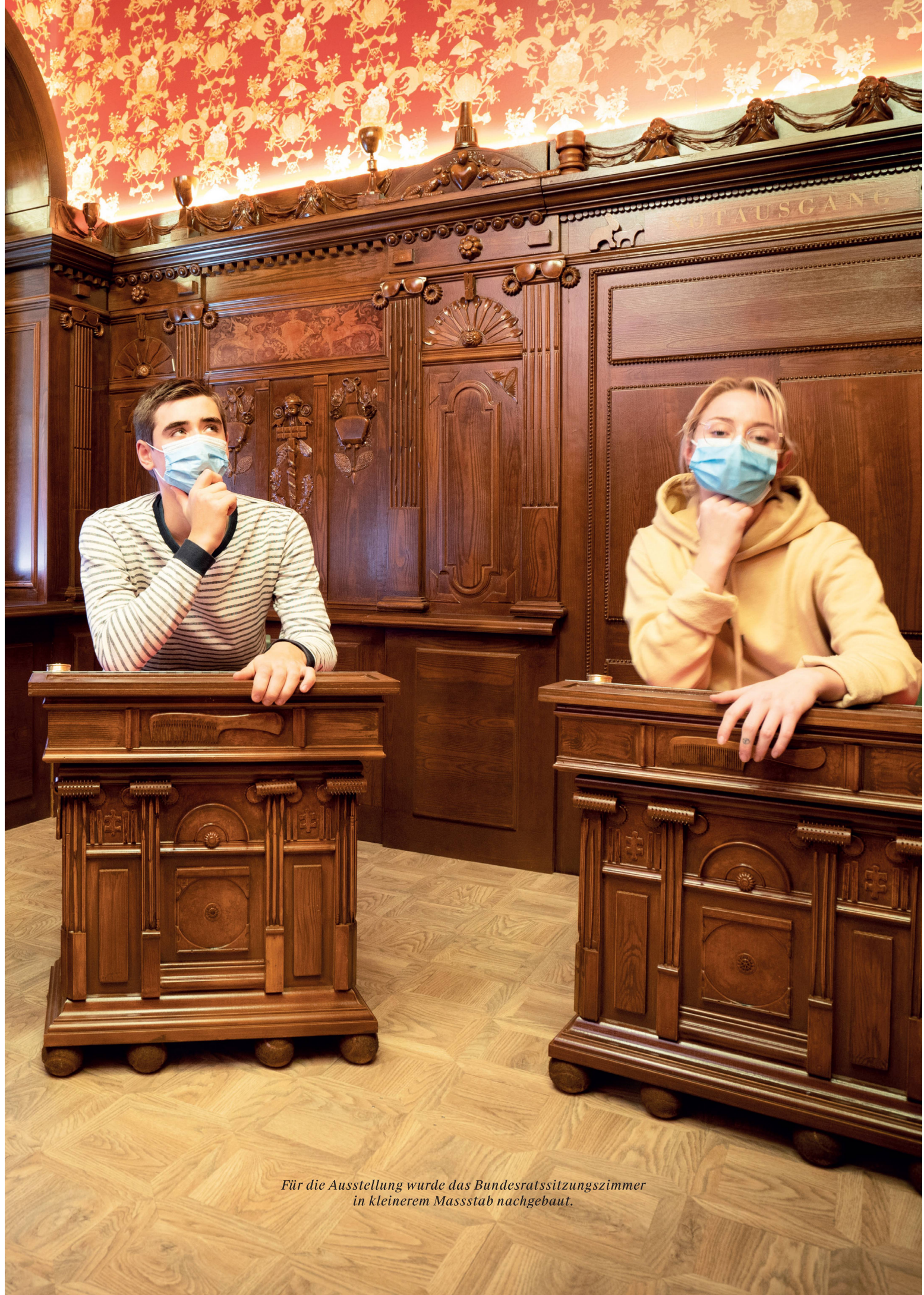
Für die Ausstellung wurde das Bundesratssitzungszimmer in kleinerem Massstab nachgebaut.