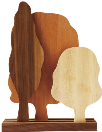
Baumbretter Schneidebretter aus Ahorn, Buche und Nussbaum, Fidea Design/CHF 99

Schöne Sachen findet man im Landesmuseum Zürich nicht nur in den Ausstellungen, sondern auch in der Boutique – und vielleicht bald schon bei sich zuhause.