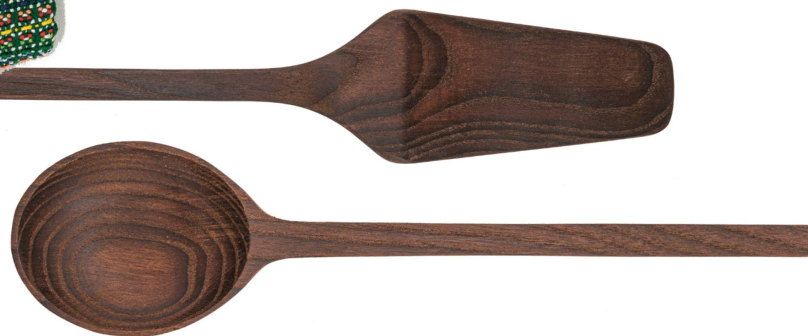
Kochbesteck: PURE Eschenholz mit einer natürlichen Maserung, handgemacht, Serax/ CHF 14.50