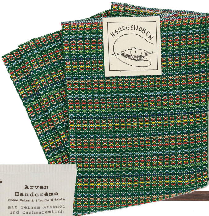
Abwaschlappen Handgewoben, Ch. Bolliger CHF 19.50