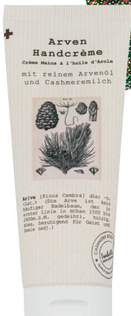
Arven-Handcrème Mit reinem Arvenöl und Cashmeremilch, 75 ml, Somea/CHF 16